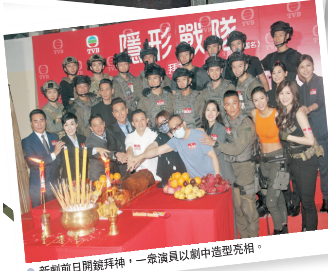
新劇前日開鏡拜神,一眾演員以劇中造型亮相。