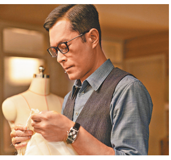
古天樂飾演梅艷芳摯友Eddie。