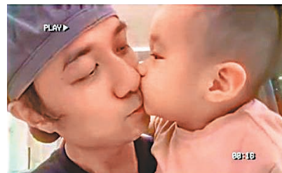
古巨基珍重仔仔的獻吻。