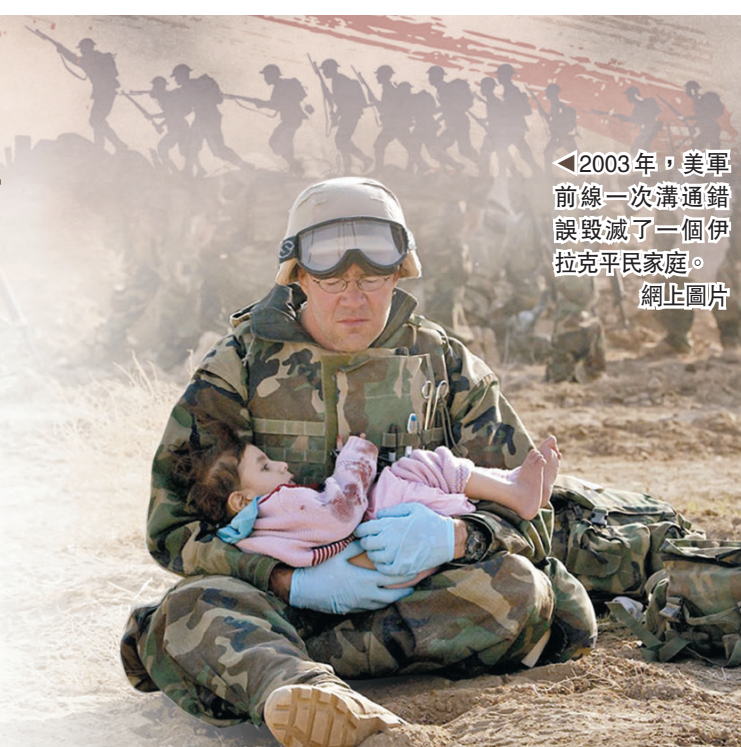
◀2003年，美軍前線一次溝通錯誤毀滅了一個伊拉克平民家庭。