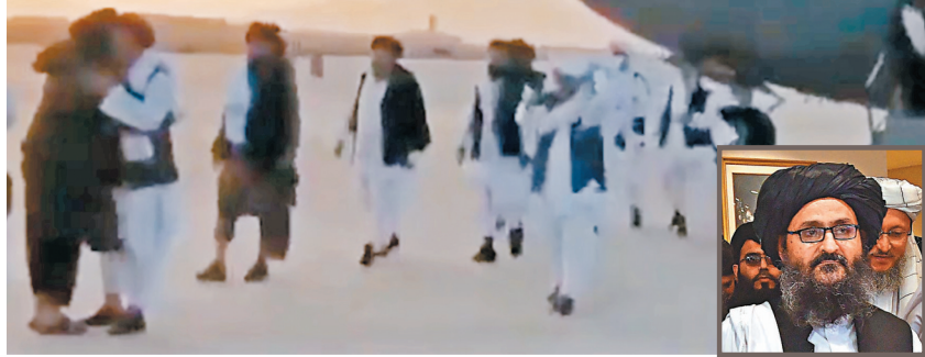
●巴拉達爾(右下圖)抵達坎大哈機場。網上圖片

阿富汗塔利班控制首都喀布爾後，外界關注新政府會如何組成。塔利班創辦人之一、二號人物巴拉達爾在流亡近20年後，前日高調返回阿富汗，被視為可能為出任新政府領袖作準備。塔利班發言人前日舉行記者會，承諾組建具包容性的政