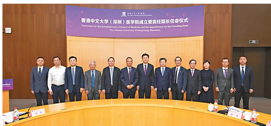
香港中文大學(深圳)醫學院17日正式成立。

香港文匯報訊 (記者李望賢深圳報道) 經過兩年多的籌建, 香港中文大學(深圳)醫學院17日正式成立, 心臟外科手術、麻醉和圍手術期循證醫學研究專家鄭仲煊教授任創院院長。今年9月首批臨床醫學專業本科新生將入學。