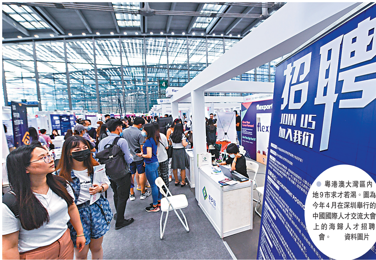
粵港澳大灣區內地9市求才若渴。圖為今年4月在深圳舉行的中國國際人才交流大會上的海歸人才招聘會。

香港文匯報訊 (記者李薇廣州報道) 在粵港澳大灣區內地9市, 哪些人才最緊缺? 有哪些行業適合港人北上施展拳腳? 這份報告給出了答案! 17日, 廣東省人社廳發布《粵港澳大灣區(內地)急需緊缺人才目錄》(以下簡稱《目錄》), 透露粵港澳大灣區內地9市急需緊缺人才超33萬人, 其中最多的是製造業, 急需緊缺人才缺口近20萬人, 超過總需求人數的一半。而在崗位方面, 技術技能崗、銷售崗、產品開發崗和擁有IT背景研發的研發崗人才最吃香, 當中不乏有適合香港青年專才的崗位類型。對於這些香港專才, 不少大灣區的企業亦給出了10萬元至30萬元(人民幣, 下同)不等的年薪。