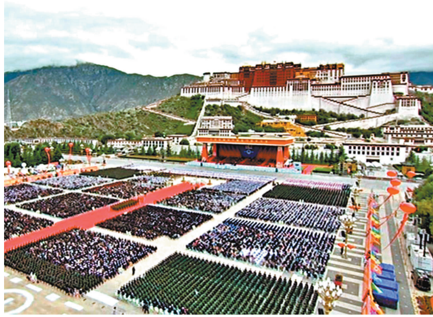
● 19日10時，慶祝西藏和平解放70周年大會在西藏自治區拉薩市布達拉宮廣場隆重舉行。央視直播截圖