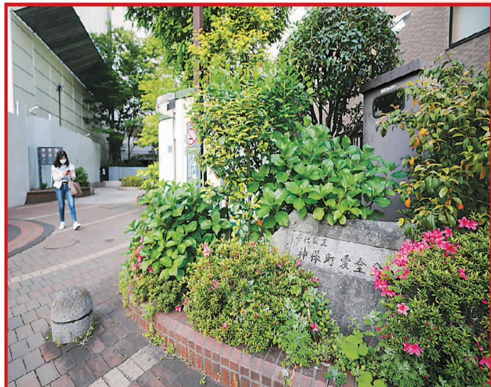
一角。一九一七年十月，周恩来进入东京的东亚高等预备学校补习日文。图为在日本东京的东亚高等预备学校旧址、现爱全公园的