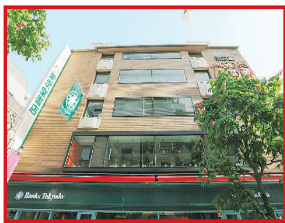
《周恩来旅日日记》中多次提到位于日本东京神保町书店街的东京堂书店。图为如今的东京堂书店。

为了进一步了解李大钊在日本求学期间的思想动态，我们找到了影印的《李大钊全集》。在查阅资料的过程中，我们注意到李大钊在早稻田大学留学期间曾写下一系列文章，从这些文章中，我们深刻感受到了李大钊在日本求学过程中时时刻刻关心国家前途命运，殚精竭虑以求救亡图存之策的高尚情怀。