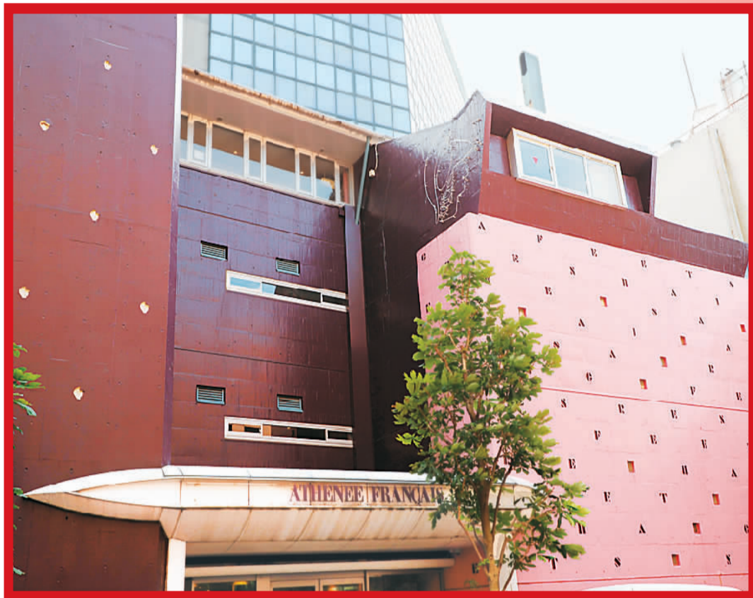
陈独秀曾在日本东京的雅典娜法语学校学习法文。图为如今位于神田骏河台的雅典娜法语学校。