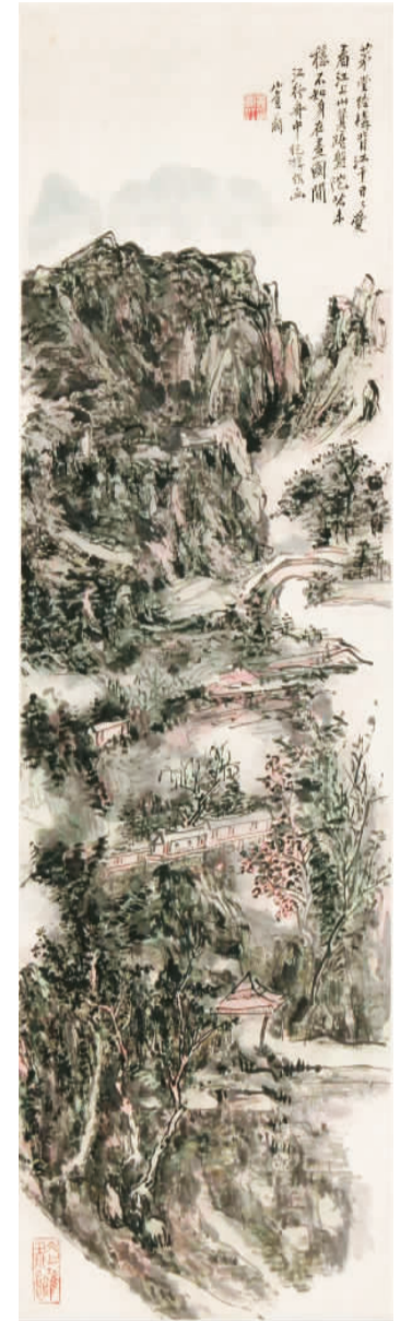
▲ 江山上（中国画） 黄宾虹

郑光旭师承俄罗斯艺术大师叶列梅耶夫，继承了俄罗斯现实主义绘画传统，又融合中国传统绘画的构图、线条和笔墨韵味，其油画创作方法以