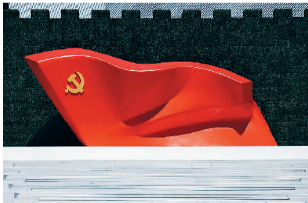
▲ 雕塑《旗帜》坐落于中国共产党历史展览馆西侧广场

在庆祝中国共产党成立100周年的各种活动中，多处能看到雕塑家吴为山的作品。其领衔创作的大型党旗雕塑《旗帜》，甫一亮相中国共产党历史展览馆，就引发关注。《旗帜》的基座高1米，旗帜部分高7.1米、长21米，象征1921年7月1日。吴为山说：“这样一面迎风招展、气势如虹的党旗，象征着中国共产党历经百年伟大历程而意气风发的气概。”