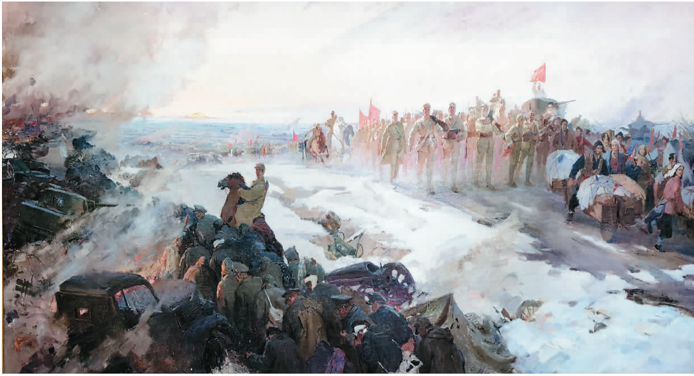
▲ 淮海大捷（油画） 鲍加 张法根 中国国家博物馆藏