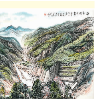
▲ 梁家河印象（中国画） 毛庐

“展出作品时间跨度大，囊括中国革命、建设、改革各个时期。古元的木刻版画《人桥》以黑版为主，套以橘红、黄绿二色，在对比中表现出硝烟四起、火光冲天的战斗气氛，映现出士兵奋勇前进的身影，艺术地还原了解放战争时期大军渡江的英勇无畏；董希文的油画《千年土地翻了身》以朴素的画风和真挚的感情，表