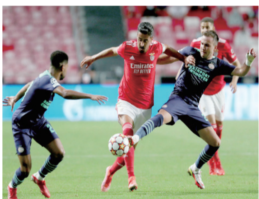
新華社里斯本8月18日電(陳柏喬)在18

日舉行的一場歐冠資格賽中，葡超本菲卡隊坐鎮里斯本光明球場2:1擊敗了荷甲勁旅埃因霍溫隊，在兩回合的淘汰賽中占據先機。