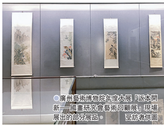
● 廣州藝術博物院年度大展「返本開新——國畫研究會藝術回顧展」現場展出的部分展品。

8月10日,企業通過「互聯網+海關」平台上的「互聯網+會展e通」系統「線上」申報進口50件(套)書畫展品,廣州會展中心海關第一時間在線審核放行,不到30分鐘所有展品都完成通關手續。第二天,這批總貨值約460萬元人民幣的進口書畫展品就由深圳前海綜合保稅區安全運送至廣州藝術博物院。