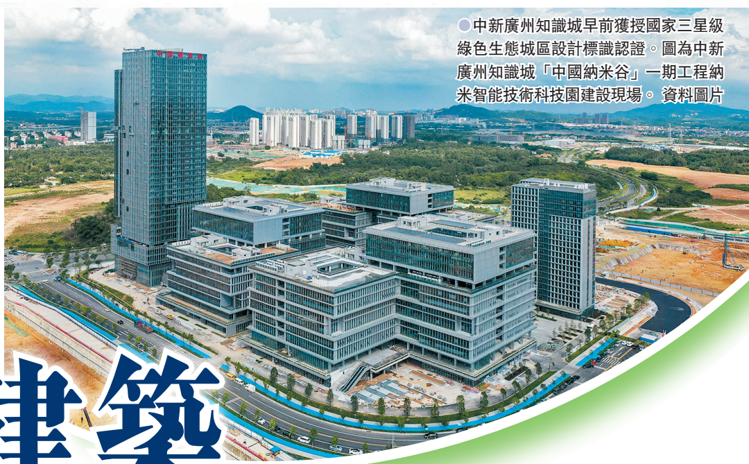
● 中新廣州知識城早前獲授國家三星級綠色生態城區設計標識認證。圖為中新廣州知識城「中國納米谷」一期工程納米智能技術科技園建設現場。資料圖片

香港文匯報訊(記者 李薇、盧靜怡 廣州報道)廣東8月16日正式印發《廣東省促進建築業高質量發展的若干措施》(下稱《若干措施》),提出18條具體舉措,圍繞價值引領、質量提升、隊伍鍛造、環境營造四個維度,構建廣東省建築業高質量發展路徑,也為香港建築工程專業人士提供新的機遇。香港文匯報記者注意到,文件在「提升建築產品和服務質量」相關板塊中,專欄規劃發展綠色建築。不少香港建築行業人士留意到相關信息,他們表示,目前大灣區綠色建築環節缺乏一站式的顧問提供解決方案,而香港建築工程業的專業人士可彌補這一塊的空缺;加上香港建築師在灣區備案執業手續簡捷,北上「舒展拳腳」的空間更大。