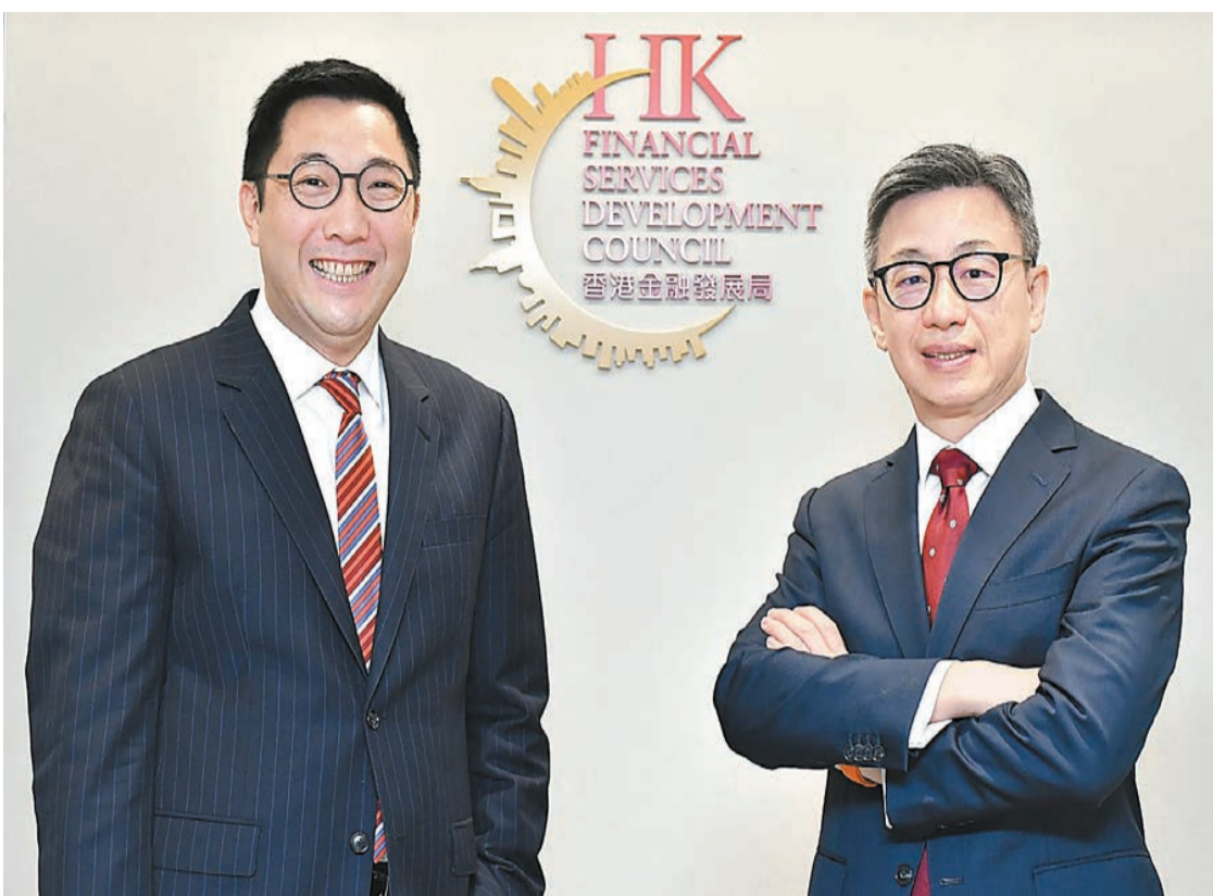
金發局指，有多達56%的金融從業員，對金融業發展感樂觀，圖左為金發局主席李律仁。

【香港商報訊】記者鄭偉軒報道：金融發展局在最新報告中表示，多達56%的金融從業員以及72.5%商科專上學生，對香港未來三年的金融業發展感到樂觀或非常樂觀。局方促請當局與業界培養香港本地金融科技(FIN-TECH)和環境、社會及管治(ESG)人才，並吸引外來者以充實金融人才資源，提升香港金融競爭力。此外，局方提醒，要留意疫情及生活成本上升等因素對金融服務的影響。