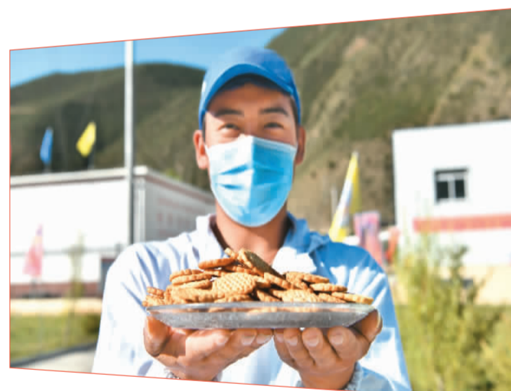
▲ 西藏洛隆县盛产青稞,当地通过开发青稞特色产品助农增收。图为洛隆县洛宗特色产品开发公司员工在展示公司生产的糌粑饼干。