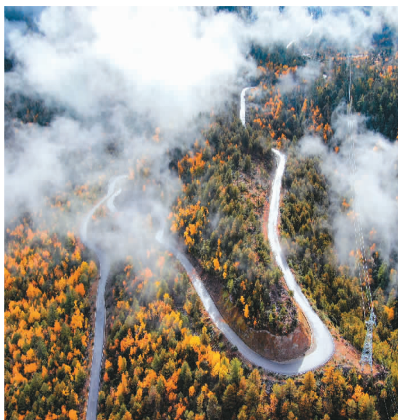
▲ 曾经,进藏难基于蜀道难,千百年来只有骡马、牦牛踏出来的古道可走。如今,由公路、航空、铁路构筑起的综合立体交通体系,连接千万藏家。图为西藏林芝派镇至墨脱公路林段的风光。