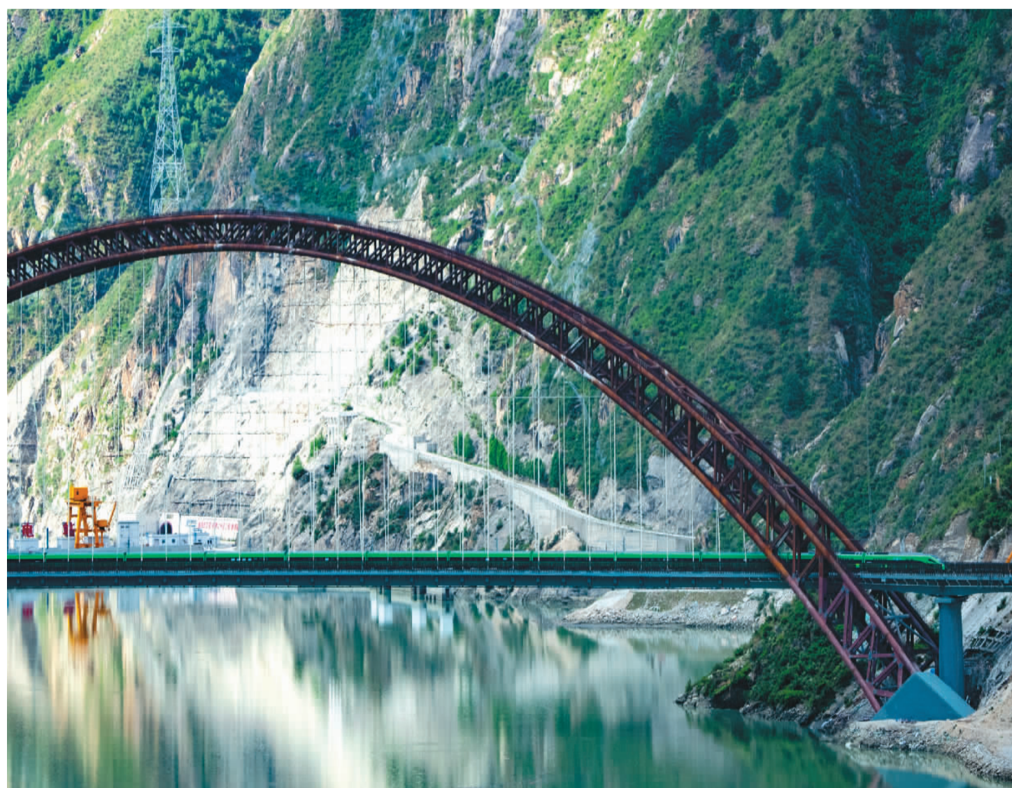
▶ 6月25日,拉萨至林芝铁路开通运营,复兴号高原内电双源动车组同步投入运营,复兴号动车组列车实现31个省市区全覆盖。图为复兴号在山南市加查县的拉林铁路藏木特大桥上飞驰而过。