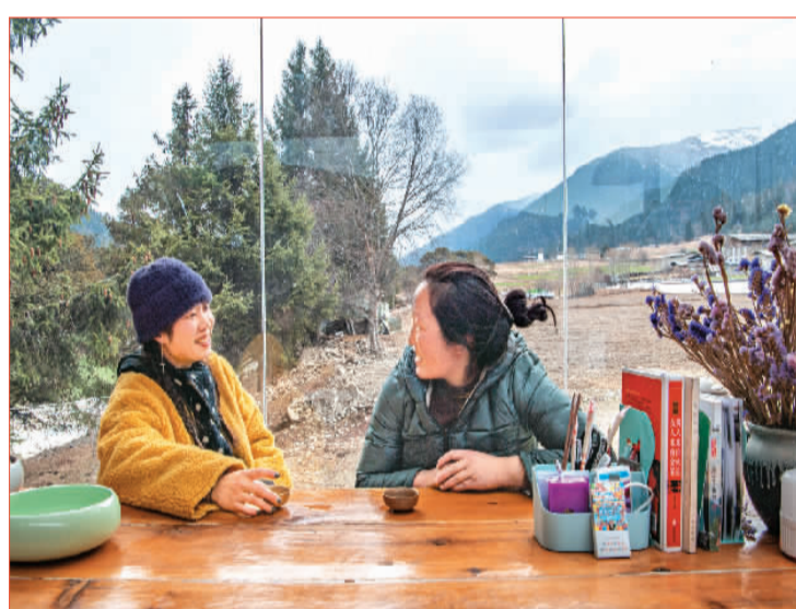
▲ 在西藏鲁朗国际旅游小镇,一座座各具特色的民宿吸引着四面八方游客。图为人们在一间牛棚改造成的民宿里喝茶聊天。