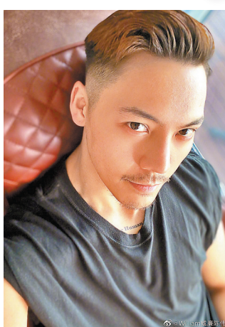
●陳偉霆出道以來緋聞不斷，桃花極旺。