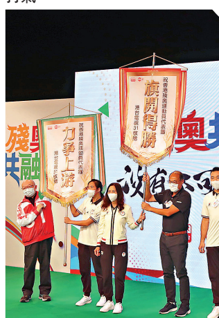
●港台前日舉行「殘奧共融睇沒有不可能」打氣大會，為一眾港將打氣。