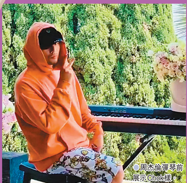
●周傑倫彈琴前展示Chok樣。