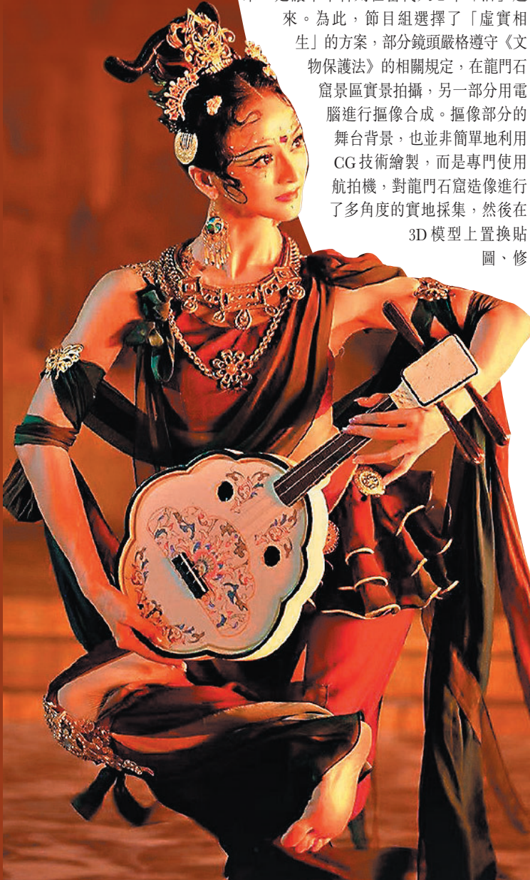
●「飛天」的舞姿還原了龍門石窟石像的姿態。

也因為河南的「不易」，導演組一直也在考慮如何去在疫情災情之下，恰當地表現一個節日，讓觀眾能夠感到慰藉與欣慰。為此，節目組在最後安排了一個流星劃過時女孩伸手一抓變成黃色菊花的鏡頭。「星星照亮回家的路，黃花祭奠洪災中遇難的同胞。」背景音裏旁白女聲說道，「你們一定要記得回家的路哦。」最後是全國各地的星空，感謝所有幫助過河南的人。