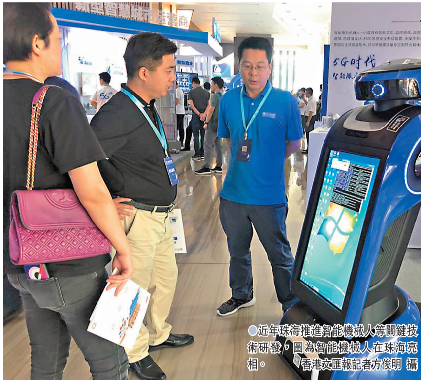
近年珠海推進智能機械人等關鍵技術研發, 圖為智能機械人在珠海亮相。

合製新冠疫苗獲批臨床試驗 入駐粵澳合作中醫藥產業園的麗凡達生物科技公司研發的「新型冠狀病毒肺炎 mRNA 疫苗」, 今年3月獲得國家藥監局核准發給的《藥物臨床試驗批件》, 成為中國第三個獲批臨床試驗的自主研發的 mRNA 新冠疫苗。記者了解到, 目前麗凡達正按計劃啟動臨床試驗, 進一步評價其臨床安全性與有效性。