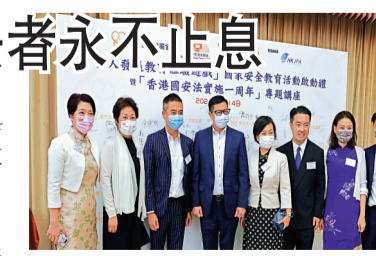
● 出席「香港國安法實施一周年」專題講座的一眾嘉賓。

香港文匯報訊 香港保安局局長鄧炳強14日在「全人發展教育體驗遊」國家安全教育活動啟動禮暨「香港國安法實施一周年」專題講座中表明, 只要有人危害國家安全, 相關部門就會執法, 「追究違法者的時間表是永不止息」! 鄧炳強在活動上發表講話指出, 他對「修例風波」感受深刻, 香港國安法社會由亂變治, 完善選舉制度更令「愛國者治港」得以全面落實。他說, 國民身份認同就是最好的國家安全教育, 香港要安居樂業離不開安全和平的社會環境, 希望市民對社會有承擔, 亦能遵守法律。鄧炳強被問到追究違法團體及個人的時間表及路線圖時指出, 追究違法者的時間表是永不止息, 強調只要有人危害國家安全, 相關部門就會執法。