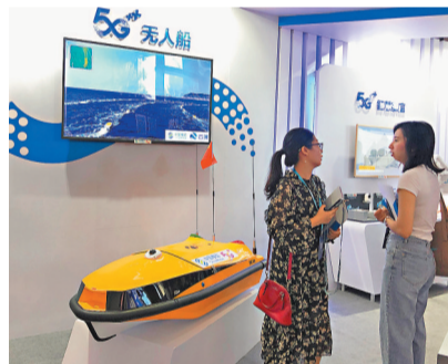
無人船艇人工智能平台落地珠海。

香港文匯報訊 (記者方俊明 珠海報道) 作為粵港澳大灣區重點發展的戰略性新興產業, 人工智能也是珠海市產業發展的重點方向。珠海市科技創新局局長王雷透露, 人工智能科技創新7大重要平台已落子珠海, 協議支持總金額超過30億元 (人民幣, 下同)。本月起施行的《珠海經濟特區科技創新促進條例》, 亦從創新主體培育、平台建設及人才引進等方面為人工智能產業發展提供全方位的支持。