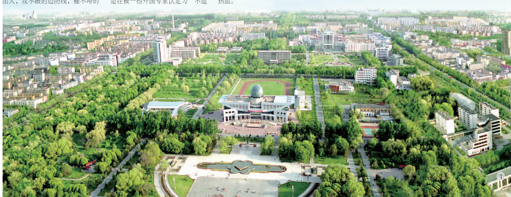
图①：新疆兵团军垦博物馆外观。图②：第四师可克达拉大桥。图③：石河子屯垦戍边纪念碑。图④：第八师石河子市鸟瞰图。