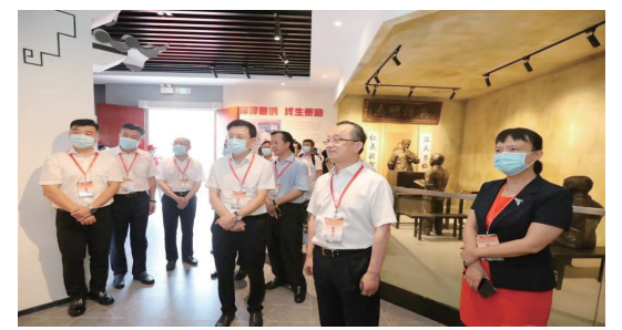
▲參觀田家炳紀念館