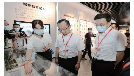
▲參觀田家炳紀念館