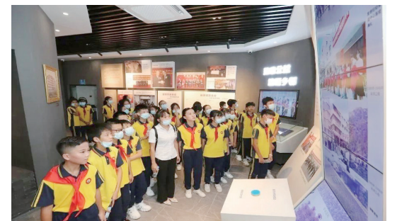
▲參觀田家炳紀念館