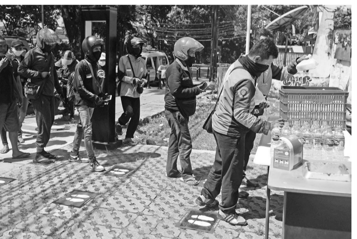
Kopi Dodol 提供免费食品 在新冠病毒大流行的压力下,为表示对弱势群体的一种关怀形式,雅加达Kopi Dodol提供了免费食品。