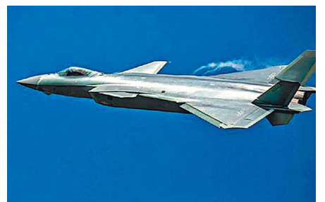
●殲-20戰機是中國新一代隱身戰鬥機。

事實上，作為殲-20的王牌發動機，其始推力超過15噸。第二階段將達到18噸左右。在第三階段，它將直接達到24噸。起初，殲-20戰鬥機使用的是99M1發動機，但在後期，它立即替換了國產的WS-10B發動機。究其原因，如果不計成本，殲-20是難以成為主力戰機的。中國曾經使用外國進口的飛機引擎，由於成本太貴了，用不起，也無法大量列入服役。所以渦扇-15「峨眉」也要向着降低成本的方向，改革設計。材料技術對於戰機引擎的製造成本，是決定性的。推力上限可以突破，如果太貴了，就需要考慮節省成本的方法。