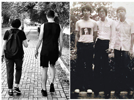
●時光荏苒，相距數十載，大埔墟再聚，滄海桑田人面全非。作者供圖