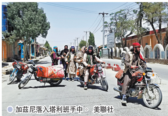
加茲尼落入塔利班手中。

完全淪陷之際，政府消息人士稱，政府談判人員已向塔利班提出權力分享協議，換取雙方結束戰事。隨着塔利班不斷推進，美國駐喀布爾使館在網站公告，促請公民離開阿富汗。