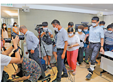
●香港教協人員10日匆匆結束記者會。

根據教協在2021年5月7日職工會登記局立案的章程，第二十條「解散」當中清楚寫明「本會必須有全體合格會員三分之二或以上以秘密投票表示同意方得解散」、「遇前項解散時，本會所欠一切合法債項皆須清還，餘款由合格會員均分或依照會員代表大會之決定處理之」。