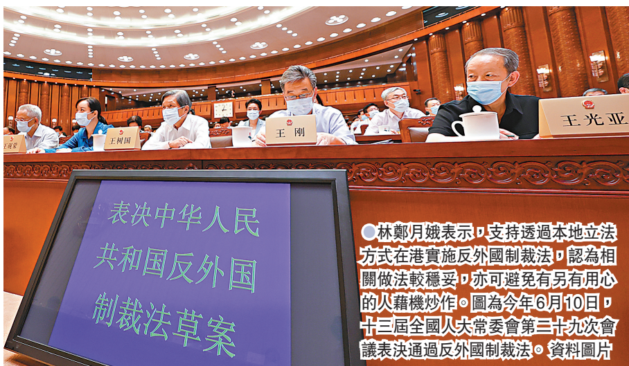
●林鄭月娥表示，支持透過本地立法方式在港實施反外國制裁法，認為相關做法較穩妥，亦可避免有另有用心的人藉機炒作。圖為今年6月10日，十三屆全國人大常委會第二十九次會議表決通過反外國制裁法。

林鄭月娥透露，特區政府提交的意見是支持應該透過本地立法程序來進行。她認為，為確保反外國制裁法有效全面準確實施，經本地立法實施較為穩妥，