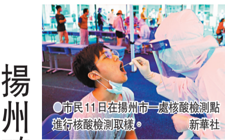
●市民11日在揚州市一處核酸檢測點進行核酸檢測取樣。

據了解，此次聯合籌劃演練有兩大特點，一是首次在聯合指揮部成立俄軍指控分中心，二是首次使用中俄專用版指揮信息系統，可內聯各個指控分中心，下接各個作戰群(隊)指揮所，必要時還可直接連兩軍單兵平台末端，既解決了語言不通問題，又提升了指揮控制實效。