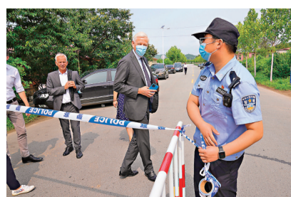
●加拿大駐華大使鮑達民11日在邁克爾獲押的丹東看守所聽取判刑。

據悉，邁克爾2018年12月起被丹東市國家安全局審查，2019年5月被逮捕，去年6月被正式起訴。丹東市中級人民法院在今年3月19日一審，由於涉及國家秘密，不公開開庭審理，邁克爾及辯護律師到庭參加訴訟。