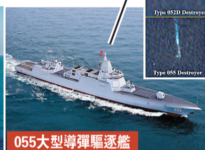
●8月6日至10日，中國人民解放軍在南海進行軍事訓練。據衛星圖片顯示，參與演習的包括國產航母山東艦(上圖)、海南號075型兩棲攻擊艦(左下)和055大型導彈驅逐艦(右下)。