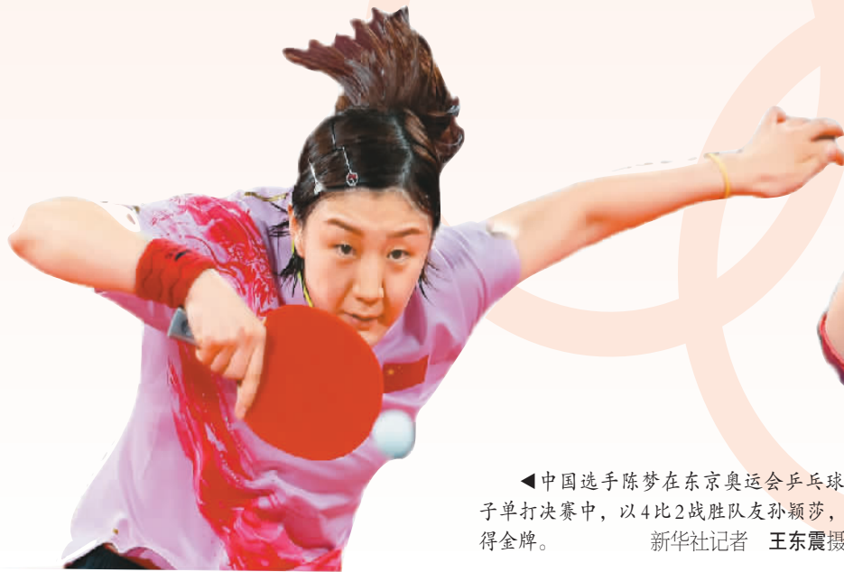
▲中国选手陈梦在东京奥运会乒乓球女子单打决赛中,以4比2战胜队友孙颖莎,摘得金牌。

中国体育代表团传统“夺金”项目延续辉煌战绩,“00后”运动员迸发活力和冲劲,众多项目取得突破性进步。在东京奥运会上,中国运动员的优异表现和辉煌成绩,频频引发外媒赞叹。