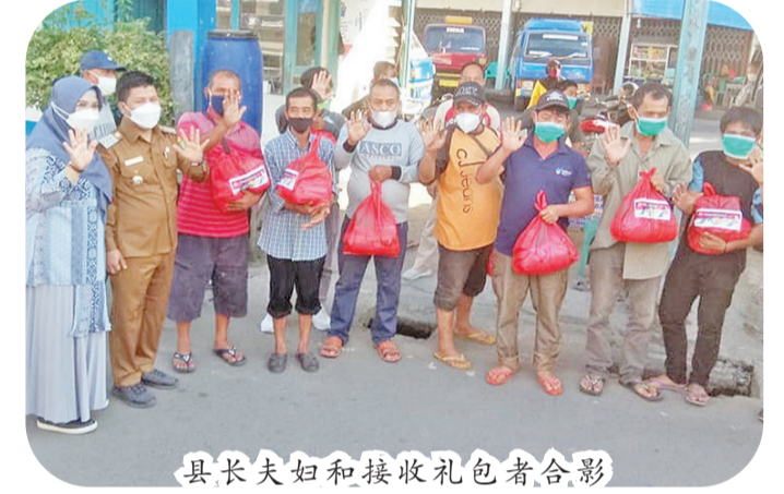
县长夫妇和接收礼包者合影