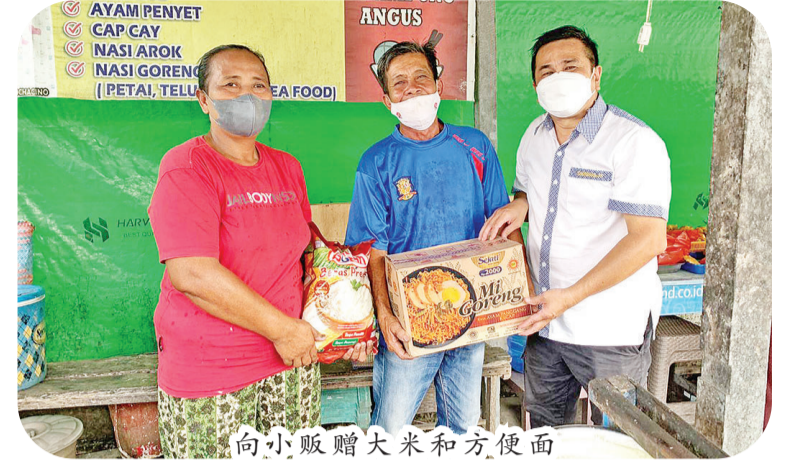
向小贩赠大米和方便面

【本报讯】2021年8月9日(星期一),雅加达“三发乡亲互助会”(Forum Gotong Royong Masyarakat Sambas “FOGOROMAS”),