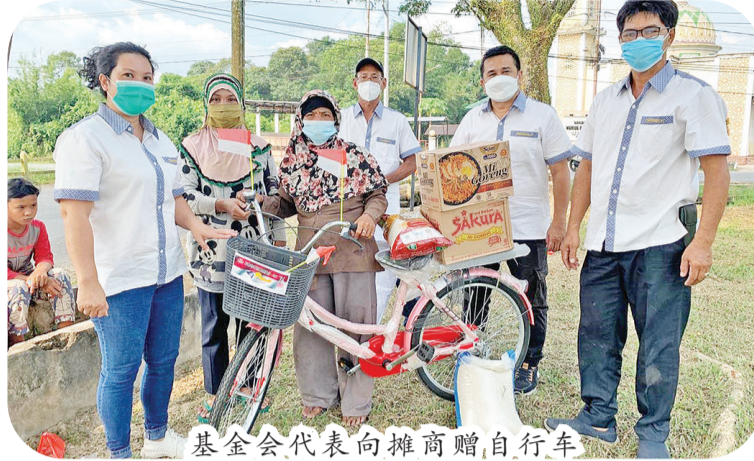
基金会代表向摊商赠自行车