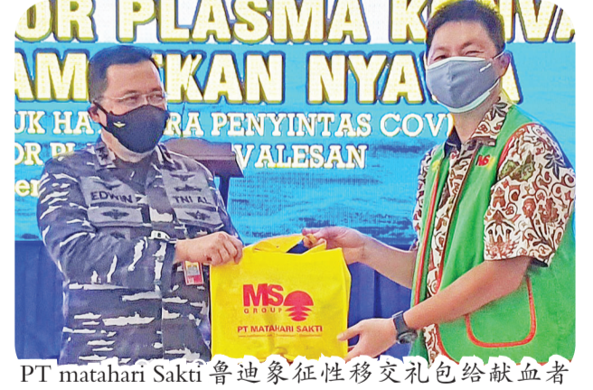
PT matahari Sakti 普迪象征性移交礼包给献血者