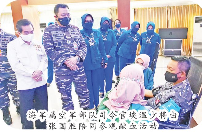
海军属空军部队司令官埃温少将由张国胜陪同参观献血活动