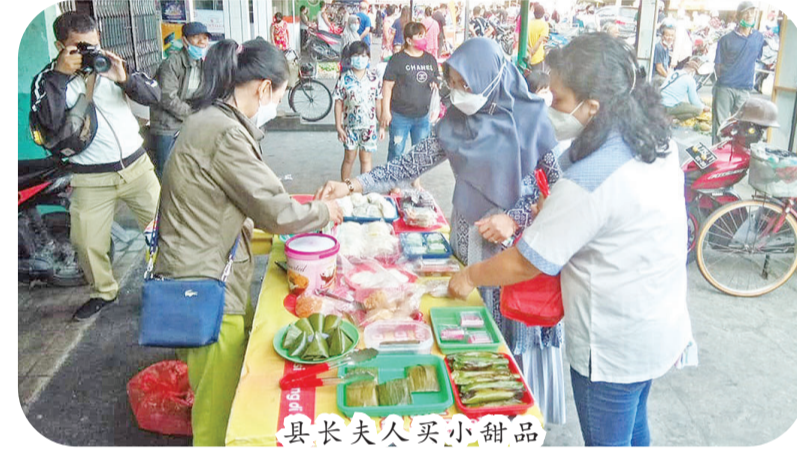
县长夫人买小甜品