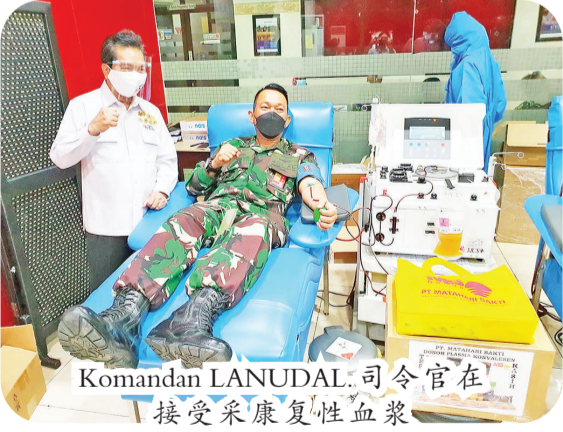
Komandan LANUDAL 司令官在接受采康复性血浆