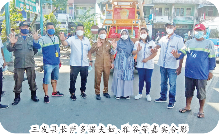
三发县长萨多诺夫妇、雅谷等嘉宾合影