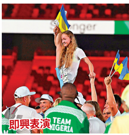
● 即興表演 TEAM NIGERIA