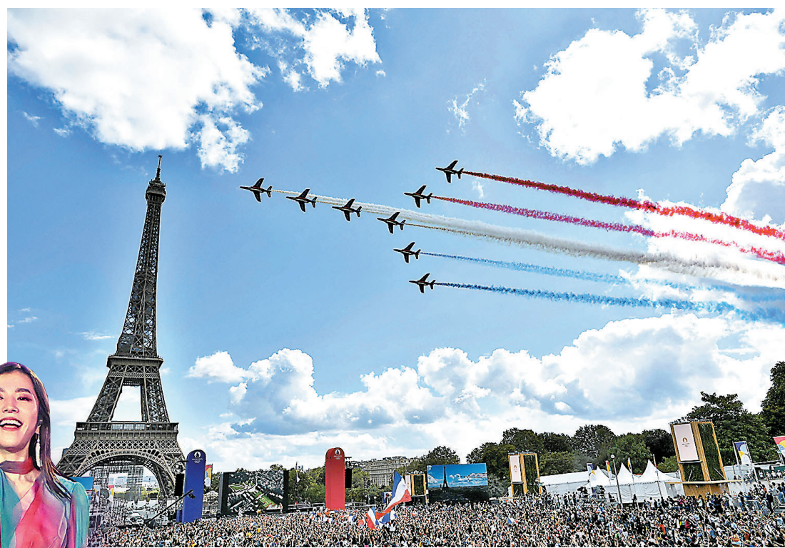
● 巴黎鐵塔下人潮湧湧。