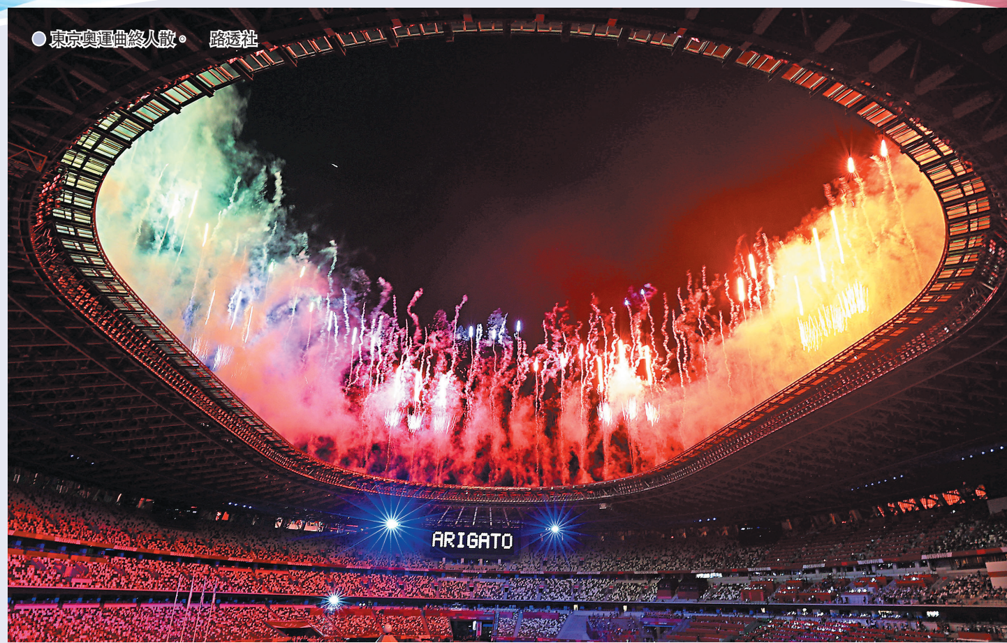
● 東京奧運曲終人散。