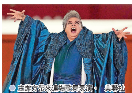
● 主辦方帶來進場歌舞表演。