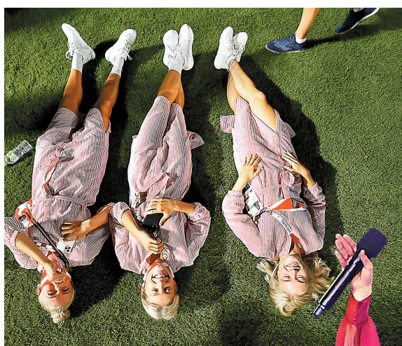
● 瑞士運動員躺在地上享受這一刻。