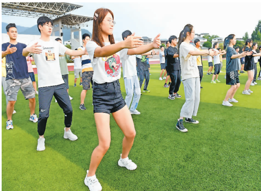
图为福建中医药大学的学生在练习该校编制的太极健身操，以达到强身健体、预防疾病的功效。