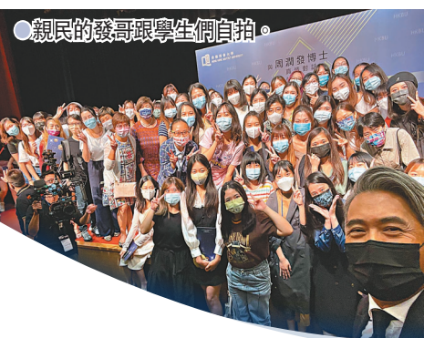
親民的發哥跟學生們自拍。

次給導演看：「電影關乎到我的前途、收入，好緊要，更關乎到香港電影，支持香港電影是要給點心機。」發哥亦覺得演員要放下身段，要以謙虛態度去協助導演成功，演員是去服務個角色，要感動到觀眾，即使遇到溝通不到的導演、不太理想的劇本，演員不好顧忌太多、理太多，只需要把角色做好：「我好欣賞吳孟達，你覺得他演出好誇張，但這個就是他的角色。」最後發哥以招牌方式與學生自拍大合照，引來一陣起哄。