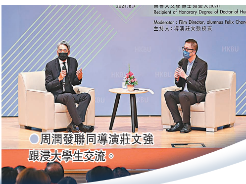
周潤發聯同導演莊文強跟浸大學生交流。