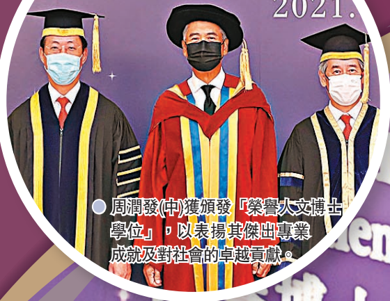
周潤發(中)獲頒發「榮譽人文博士學位」，以表揚其傑出專業成就及對社會的卓越貢獻。