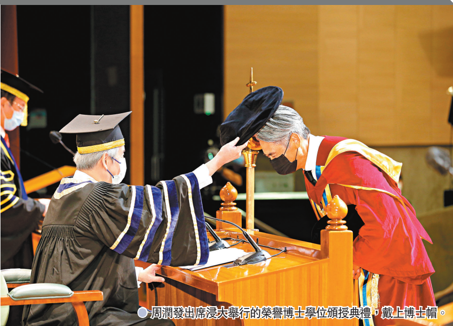
周潤發出席浸大舉行的榮譽博士學位頒授典禮，戴上博士帽。