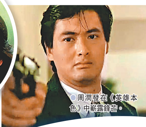
周潤發在《英雄本色》中靚靚發。