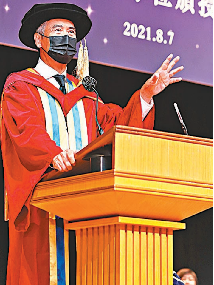
周潤發致謝辭，將其在演藝圈的發展史娓娓道來。