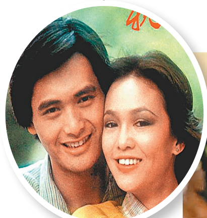
原來鄭裕玲(右)是周潤發入無綫後見最多的人。