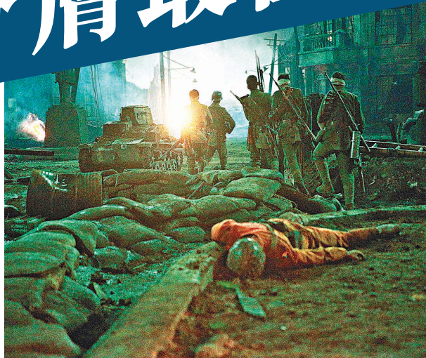
《八佰》是一部以戰爭為題材的電影。