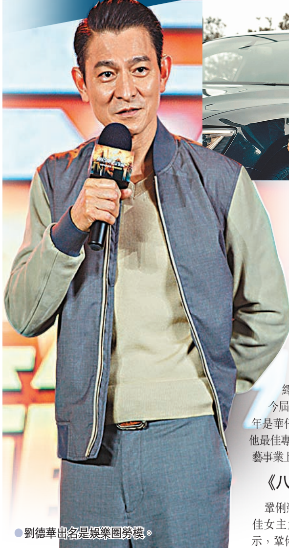
劉德華出名是娛樂圈劳模。