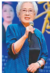
資深演員秦怡。