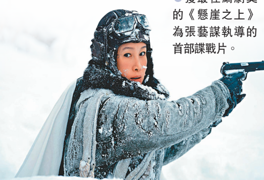
獲最佳編劇獎的《懸崖之上》為張藝謀執導的首部諜戰片。