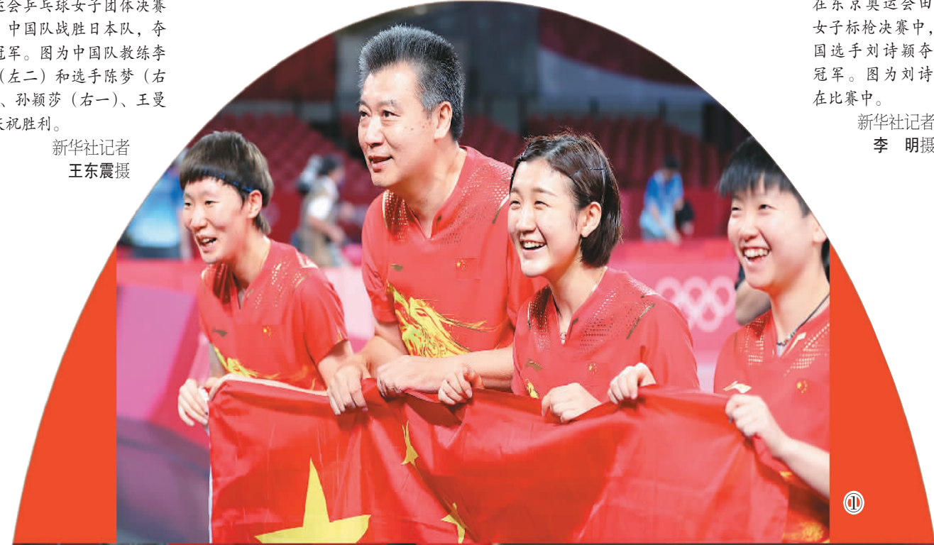
图③：8月6日，在东京奥运会田径女子标枪决赛中，中国选手刘诗颖夺得冠军。图为刘诗颖在比赛中。