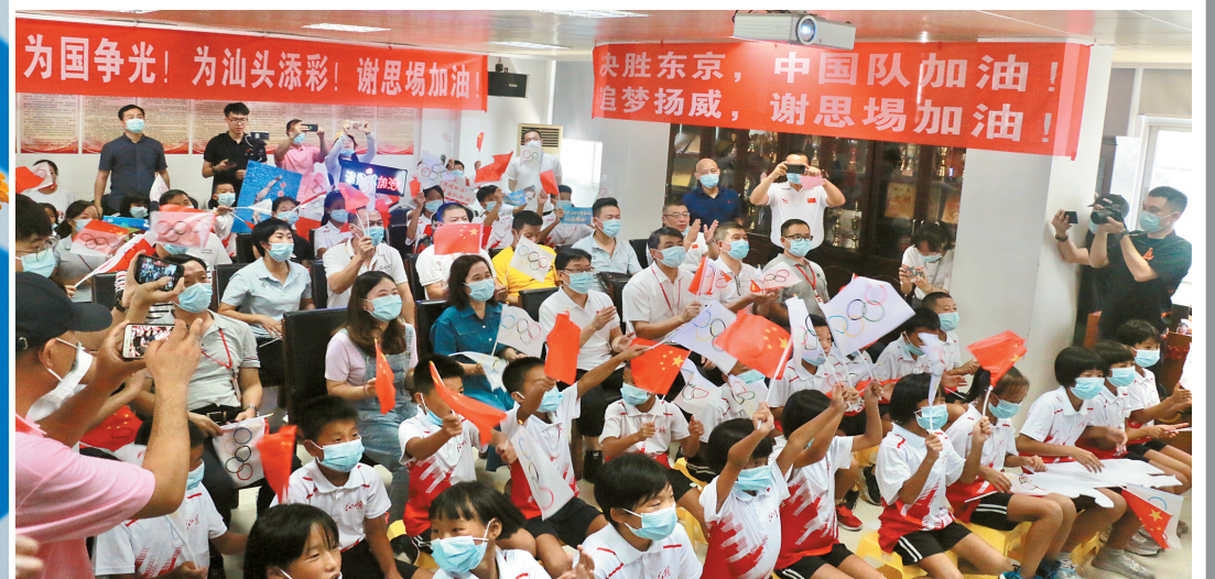
謝思場家人和體校師生隔空加油助威。林業 攝

男子3米板單人、雙人冠軍。2018年8月28日，他奪得2018雅加達亞運會跳水男子3米雙人跳板冠軍；8月31日，奪得亞運會跳水男子3米板冠軍。2019年7月18日，謝思場獲得2019游泳世錦賽男子3米板冠軍，同年在武漢舉行的第七屆世界軍人運動會跳水比賽上獲得男子3米板單人、雙人和團體冠軍。2020年10月4日在河北舉行的全國冠軍賽暨東京奧運會選拔賽上，他不負衆望，獲得男子3米板冠軍。回顧謝思場的成長歷程，他的奧運之旅却不是一帆風順。2014年初，謝思場因腳腕骨折接受手術，腳上多了兩根鋼釘和一根鉚釘。受傷的腳踝，使他無緣2016年裏約奧運，他的奧運首秀也因此推遲了五年。