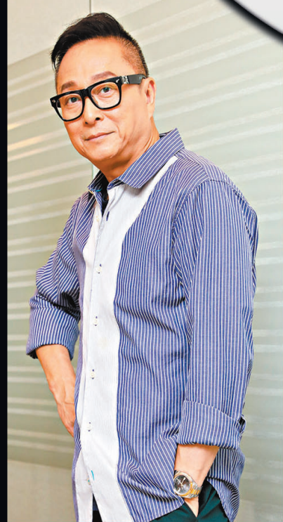
●蛇仔坦言大家好眼淺，不知演出時會不會喊。