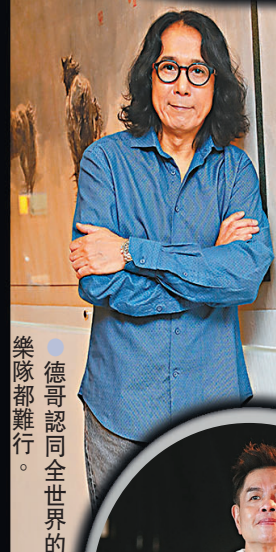
●德哥認同全世界的樂隊都難行。