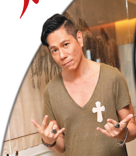
●Joey 透露好多朋友都想參與今次演唱會。