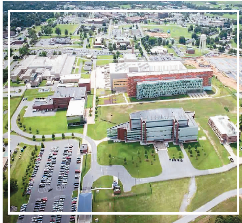
位于美国马里兰州的德特里克堡生物实验室。

密?美国政府为何对德堡种种漏洞遮遮掩掩,讳莫如深?美国民众对德堡的质疑何时能获得官方回应?国际社会对美国生化武器研究的批评何时能得到美国正视?新冠病毒溯源,不查德堡,难以服众!