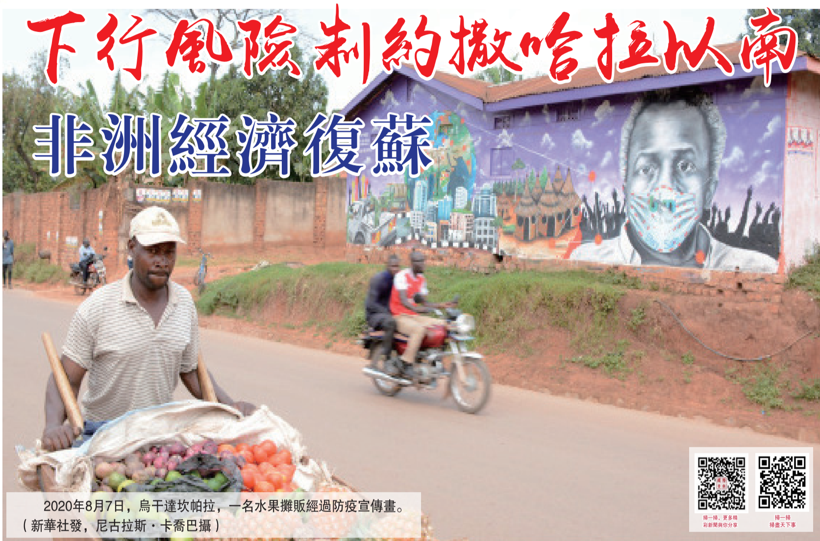
2020年8月7日，烏干達坎帕拉，一名水果攤販經過防疫宣傳畫。