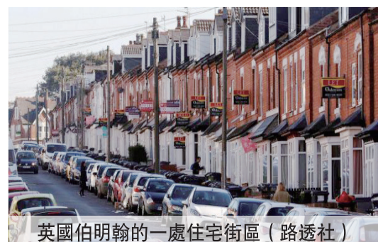
英國伯明翰的一處住宅街區

美國銀行經濟學家阿蒂亞·巴韋說，世界各地的政策制定者“現在敏銳地意識到了住房政策帶來的風險”。他還補充說，跟2008年的時候相比，這“大大減少了出現不利結果的可能性”。