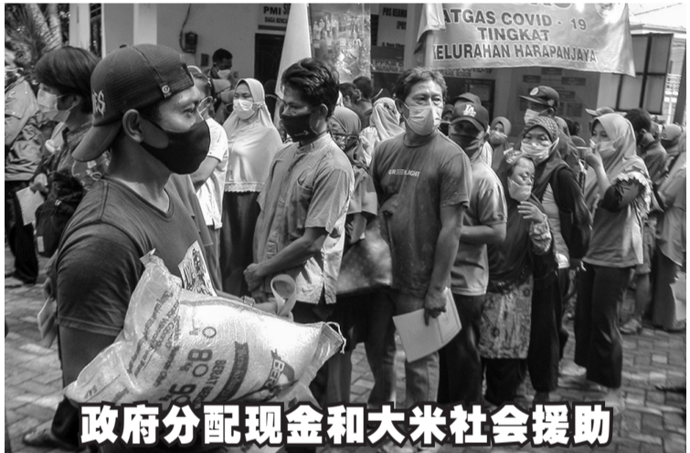
政府分配现金和大米社会援助

鲁特菲部长补充道,印尼与欧盟国家的贸易可说令人欢欣,印尼对荷兰的贸易顺差为16.7亿美元,对西班牙的贸易顺差为8亿美元,以及对意大利的贸易顺差为2亿美元。他说:“我们从这3个欧洲国家获得几乎相当于27个欧盟国家的100%顺差价值,因此这3个国家是我国在欧盟最重要的贸易伙伴,贸易顺差共达25亿美元。”(Ing)