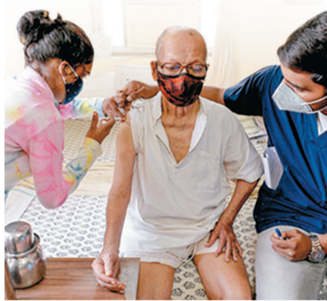
●志願者上門為印度老人打針。