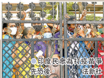
●印度民眾為打疫苗爭先恐後。