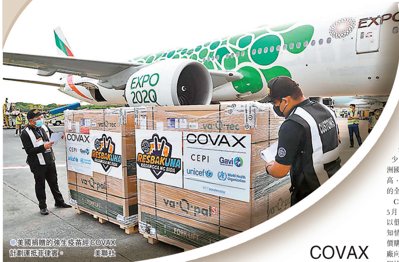
●美國捐贈的強生疫苗經COVAX計劃運抵菲律賓。

新冠疫情去年初爆發後，世界衛生組織等國際機構牽頭成立「新冠疫苗實施計劃」(COVAX)，務求確保在疫苗面世後，疫苗可盡快在全球公平分配，不過在疫苗面世超過半年後，經過COVAX分發給各國的疫苗只有1.63億劑，遠低於原定的最少6.4億劑目標，而且很多發展中或落後國家，亦沒有資金來準備接種工作所需的配套設施，變種病毒開始在接種率低的國家蔓延，當初COVAX力求避免的情況已經出現。有專家直斥，COVAX就是一項群龍無首的項目。 ●香港文匯報記者 文玟