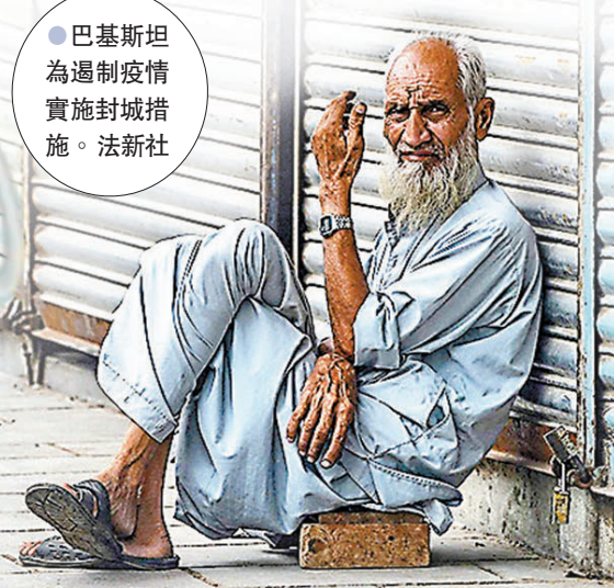
●巴基斯坦為遏制疫情實施封城措施。

以孟加拉為例，當地2月將近100萬名羅興亞人納入接種計劃，但至今僅獲COVAX供應約10萬劑疫苗，佔預期接收劑量不足1%，令羅興亞難民遲遲未能打針。印度為了顧及應對本地疫情，暫停向外出口疫苗，嚴重影響COVAX供應，導致部分國家雖然已展開難民接種計劃，但現在難以安排打第二針。