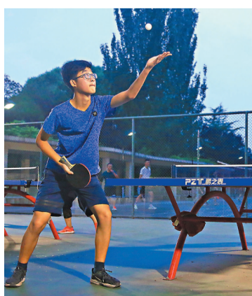
●國務院印發《全民健身計劃》，就今後一個時期促進全民健身更高水平發展。圖為市民在北京一公園內打乒乓球。

《計劃》還提出，大力發展運動項目產業，積極培育戶外運動、智能體育等體育產業，催生更多新產品、新業態、新模式。在國家體育消費試點城市基礎方面，擇優確定一批國家體育消費示範城市，充分發揮試點城市、示範城市作用，鼓勵各地創新體育消費政策、機制、模式、產品，加大優質體育產品和服務供給，促進高端體育消費回流。