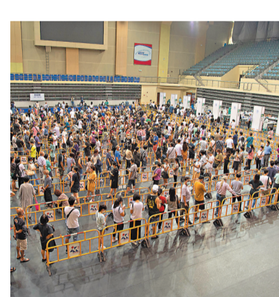
●8月4日，市民在澳門中葡職業技術學校體育館進行核酸檢測。中通社

因應澳門最新疫情發展，香港特區政府亦於4日起將澳門剔出「回港易」計劃外。拱北封閉式管理 口岸須12小時內核檢 同時，珠海市也立即啟動全市全員核酸檢測。除保障珠澳兩地正常生產生活的跨境貨車司機外，4日起，經珠海口岸出境人員需持12小時內核酸檢測陰性結果證明。另外，珠海市對拱北片區實行封圍式管理，部分地方實行封控措施，並將珠海市香洲區拱北街道全區域作為警戒區域，實行「兩點(居住點+工作點)一線，非必要不離開」管理措施。