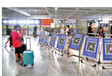
●旅客在長沙高鐵南站掃健康碼。

來勢洶洶的德爾塔變異株，攪亂全球新冠疫情防務。作為防疫優等生的中國，近期也發生多起德爾塔變異株本土感染疫情，涉及15個省份，報告超過300例確診。此次源起於南京接口國際機場的疫情，已被認為是繼「武漢保衛戰」後，中國防疫面臨的最大挑戰。