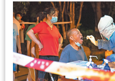
●武漢市民3日在東湖風景區華僑城社區檢測點進行核酸檢測。新華社

香港文匯報訊 綜合報道：湖北省及北京市4日召開的疫情防控新聞發布會上透露的信息顯示，武漢市及北京市此輪疫情樣本與近期南京疫情病毒Delta毒株高度同源。武漢市2日通報的7例病例中，已完成的2例樣本測序結果顯示為Delta型，與江蘇本輪病例毒株高度同源。北京市新增3例京外疫情關聯本地新冠肺炎确诊病例，均為8月1日公布确诊病例的密切接触者，其中2例為确诊病例親屬，有湖南省張家界市旅行史，1例為确诊病例同航班密切接触者，樣本也與近期南京疫情病毒全基因组高度同源。