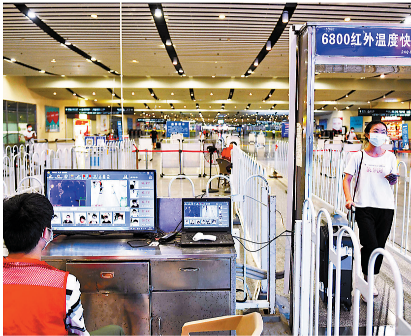
●內地交通部門升級疫情防控措施。圖為湖南進一步加強對重點地區入湘、返湘人員的排查管理，全面抓好各類入湘管控。