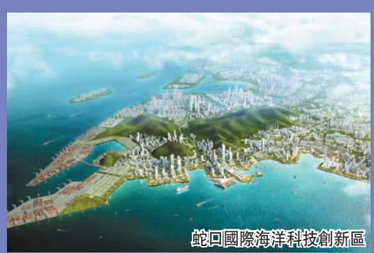
蛇口國際海洋科技創新區