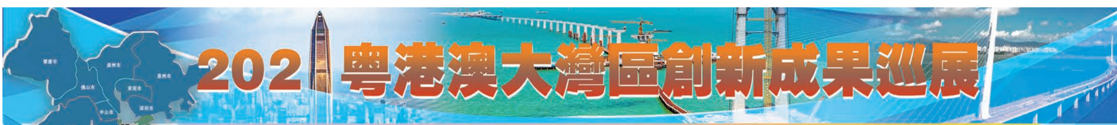
西麗湖國際科教城