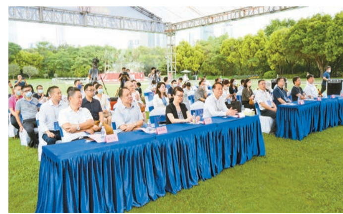
啓動儀式活動現場。

【香港商報訊】記者林麗青報道：2021粵港澳大灣區創新成果巡展活動以「對標國際一流灣區、聚焦創新引領發展」爲主題，聚焦粵港澳大灣區國際科技創新中心建設，充分展示大灣區創新發展成果。當前，粵港澳三地創新資源正加快集聚，大灣區國際科技創新中心的影響力顯著增強。粵港澳合力推進廣深港澳科創走廊建設，科技設施聯通、科技要素暢通、創新鏈條融通的創新網絡初步形成。