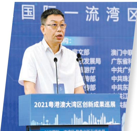
廣東省科技廳二級巡視員何棟華

【香港商報訊】廣東省科技廳二級巡視員何棟華昨日出席「2021粵港澳大灣區創新成果巡展」活動啓動儀式並發表致辭。