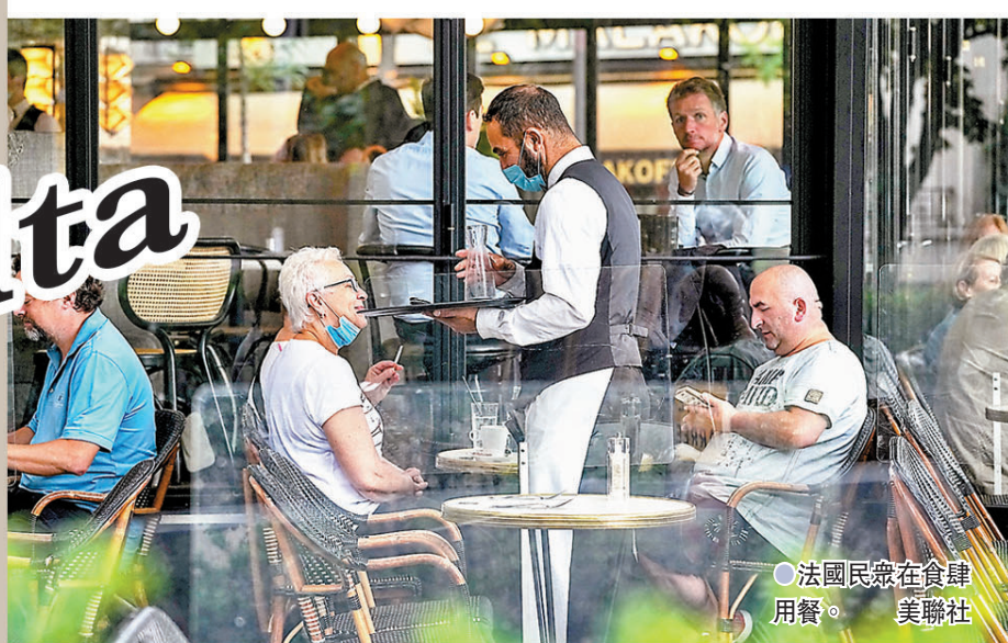
法國民眾在食肆用餐。