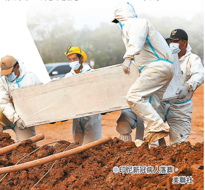
印尼新冠病人落葬。

大多數 GDP 數據主要來自 2019 年至 2020 年。疫苗數據截至上月 28 日。資料來源：凱澤基金會/Our World in Data/世界銀行