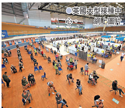
英國大型接種中心。

德國目前約有 52% 人口完成接種疫苗，計劃建議開放全國的接種中心，為所有 12 歲至 17 歲青少年打針。斯潘上週六便指出，德國的 12 歲至 17 歲青少年中，已有約 20% 接種首劑疫苗，目前疫苗供應充足，任何合資格人士均可打針。