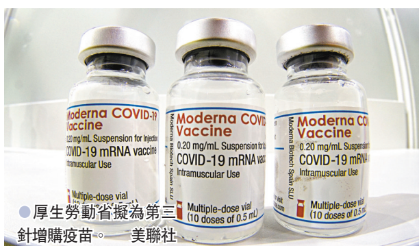
厚生勞動省擬為第三針增購疫苗。

日本目前只有不足四成民眾接種至少一劑疫苗，進度相對其他富裕國家緩慢，但日本政府擔憂傳染力強的新冠變種病毒擴散，以及疫苗帶來的免疫能力隨時間下降，厚生勞動省正研究明年為民眾接種第三劑疫苗。