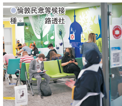
倫敦民眾等候接種。