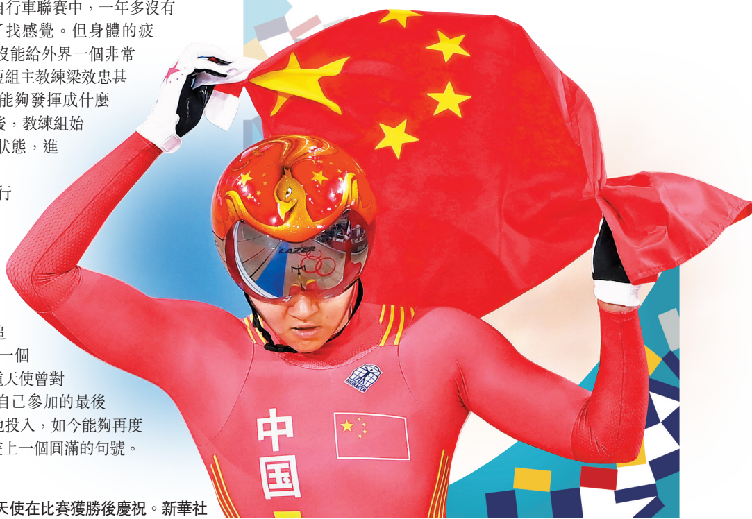
● 8月2日，中國隊選手鍾天使在比賽獲勝後慶祝。

此前在浙江長興的一場場地自行車聯賽中，一年多沒有比賽的鍾天使使用兩場比賽找找感覺。但身體的疲憊，加上前期受傷病困擾讓她沒能給外界一個非常有底兒的信號。場地自行車隊短組主教練梁效忠甚至形容「封閉訓練後，在賽場能夠發揮成什麼樣，大家心裏沒底。」自那之後，教練組始終在想方設法幫助鍾天使調整狀態，進行體能、專項上的強化。如同很多項目一樣，中國自行車隊在本屆奧運會上也是老帶新，「如果只是自己一個人在前面跑，並不會有很大的動力去往更高更遠的地方走，但是如果後面的年輕運動員一直在推着你走，一直在追趕着你走，這其實對我來說是一個非常積極的事情。」在賽前，鍾天使曾對媒體透露，東京奧運會可能是自己參加的最後一屆奧運，因此希望能全身心地投入，如今能夠再度奪金，相信會給她的運動生涯畫上一個圓滿的句號。