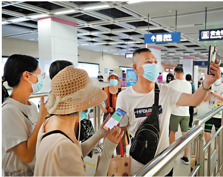
●8月3日，武漢地鐵實行「亮綠碼通行」的首個早高峰平穩有序，乘客掃碼後亮綠碼進入地鐵循環門站乘車。中新社