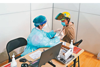
●南京市民接種疫苗。新華社

「突破感染」指病毒突破了疫苗的防線，導致完成疫苗接種的人感染疫苗本該預防的疾病。這是因為所有疫苗保護效力都難以達到100%，保護效力越低，「突破感染」發生率越高。即便是保護效力最好的疫苗，個體差異也會導致在免疫反應較低的個體上發生「突破感染」。很多病毒突變快，對現有疫苗產生逃逸，也會造成「突破感染」。在全球疫苗歷史上，「突破感染」情況時有發生，比較典型的就病毒突變造成的流感和乙肝疫苗接種後的「突破感染」事件。近期，新冠變異株德爾塔(Delta)導致的「突破感染」更為多見，專家表示，雖然尚不能確定是由疫苗對該毒株的保護效力較原型株減弱，還是由該毒株本身感染力和傳播效率更高所致，但目前已上市各種疫苗的免疫後血清抗體對某些毒株的中和活性確實有所減弱。專家認為，應對「突破感染」，一方面要繼續提高接種覆蓋率，一方面也應繼續保持社交距離、戴口罩、高檢測率等措施。 ●新華社