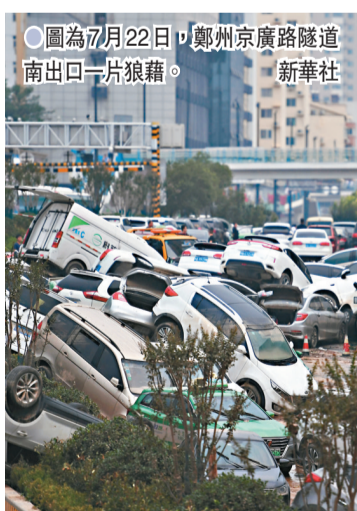
●圖為7月22日，鄭州京廣路隧道南出口一片狼藉。