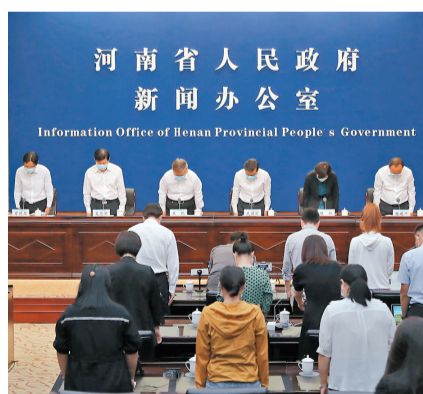
●8月2日，在河南省政府新聞發布會上，在場人員全體起立，向因災遇難同胞和犧牲同志致哀。

香港文匯報訊（記者馮雷河南報導）8月2日，據河南省政府新聞辦第十場河南省防汛救災新聞發布會消息，截至8月2日12時，此次特大洪澇災害共造成302人遇難，50人失蹤。其中鄭州市共遇難292人，失蹤47人。中國國務院決定成立調查組，由應急管理部牽頭，相關方面參加，對河南鄭州「7·20」特大暴雨災害進行調查。調查組聘請專家為調查工作提供技術支撐。調查組將依法依規、實事求是、科學嚴謹、全面客觀地對災害應對過程進行調查評估，總結災害應對經驗教訓，提出防災減災改進措施，對存在失職瀆職的行為依法依規予以問責追責。