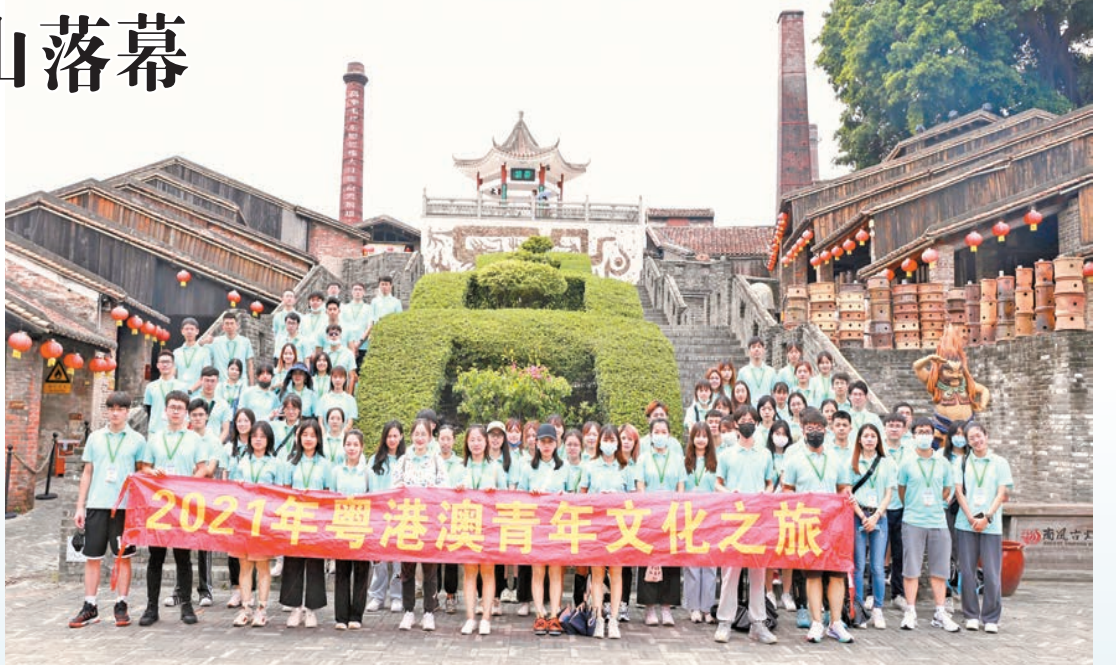
三地學子參觀佛山500年薪火不滅的南風古灶。

【香港商報訊】記者胡嘯原報道：7月26日至31日，由廣東省文化和旅遊廳、香港特區政府民政事務局和澳門特區政府教育及青年發展局聯合主辦，佛山市文化廣電旅遊體育局承辦的「嶺南文化 佛山功夫——2021年粵港澳青年文化之旅」成功舉辦。70多名粵港澳三地大學生走進澳門、佛山兩地，深度體驗了「時尚、尋味、創新、愛國、傳承、文明」等不同主題、內涵豐富的文化體驗活動，共同探尋粵港澳大灣區的發展機遇。