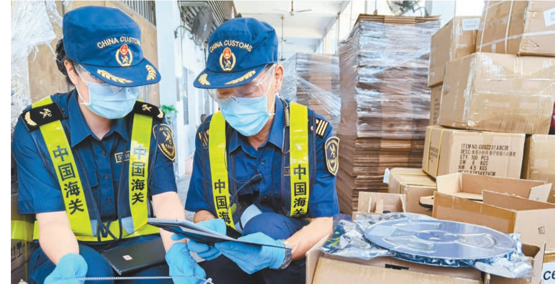
皇崗海關關員驗放「兩步申報」模式下的通關貨物。

廣東「兩步申報」「提前申報」改革與其他多項改革疊加，效果明顯。如配合「兩段准入」等改革，企業可實現進口貨物「船邊直提」、出口貨物「抵港直裝」。進口貨物「船邊直提」後，提離時間縮至5-8分鐘，出口壓縮至2小時，通關時間大幅壓縮，物流成本明顯降低。疊加「匯總徵稅」，企業則可按完整申報時間計算稅費起繳時間並在計稅處理完成後、下一個月第5個工作日結束前匯總支付，最長緩稅期限可達40餘天。疊加「兩區優化」，實現「先入區、後報關」「先入區、後入賬」。部分特殊監管區域供應鏈企業利用改革快捷高效的通關優勢，逐步減少在香港的理貨倉庫，增加在境內和特殊區域倉庫進行理貨和倉儲，企業運營成本有效壓降。