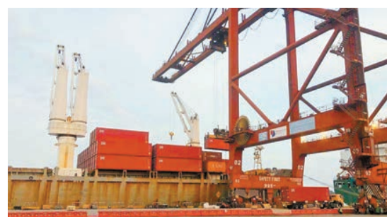
深圳港不斷提高集裝箱周轉效率。

據統計，碧桂園作為一家世界500強企業，直接和間接創造就業崗位超200萬個，2020年全年納稅總額653億元。