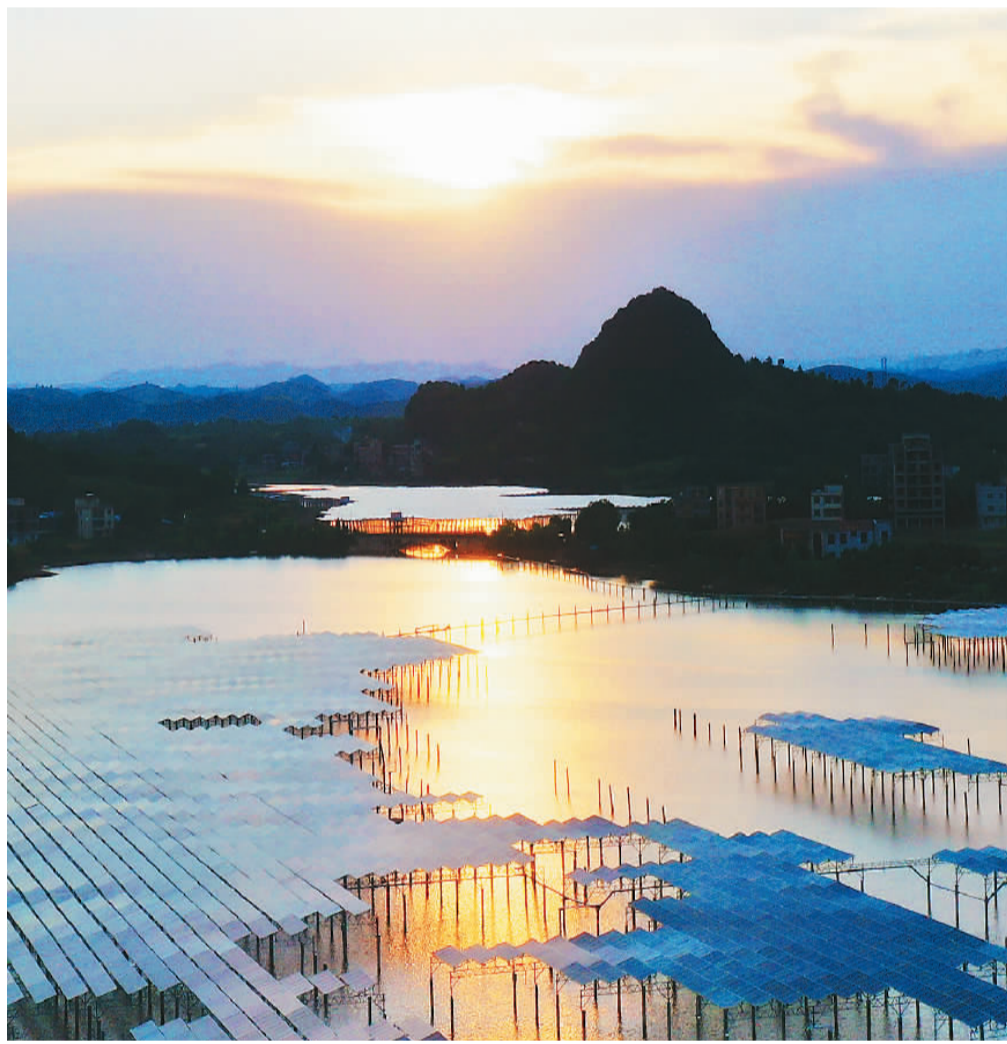
八月一日,湖南省郴州市嘉禾县千家洞水库“渔光互补”光伏发电场,光伏发电和水面在晚霞映照下交相辉映,犹如一首美丽的“渔光曲”。该项目于近期完成施工并网发电,构建了水面发电、水下养殖相结合的绿色发展模式。

湖南省支持推动中小企业坚持走专精特新发展道路,产业链和供应链、稳定性、竞争力不断提升。湖南连续5年实施“小巨人”培育计划,全省已培育5批共1301家专精特新“小巨人”企业,70家企业入选工信部专精特新“小巨人”企业名单。