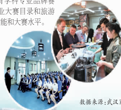
数据来源：武汉商学院

通过加速构建“一专四金”人才培养体系，武汉商学院正不断提升人才培养质量，使学科专业布局更加科学合理，实现全面提升人才培养质量的目标。