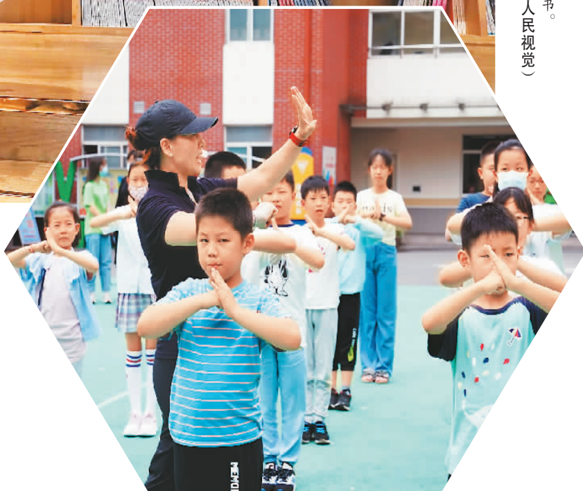
▶ 位于上海市徐汇区汇师小学分校的爱心暑托班办班点内，小学生在老师指导下练习武术基本动作。