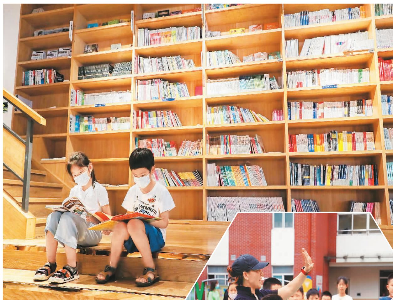
▲ 孩子们坐在江苏省淮安市淮阴区新华书店台阶上看书。