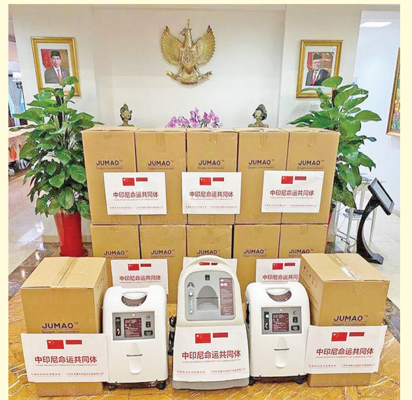
捐赠的抗疫物资医用制氧机