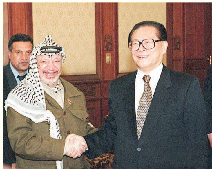
1999年4月15日，江泽民在北京钓鱼台国宾馆会见巴勒斯坦总统阿拉法特。

说中国是第一个承认巴勒斯坦地位的非阿拉伯国家。此外，阿拉法特还保持着每年必须有一次与中国领导人交换意见的习惯。2001年阿拉法特根据《奥斯陆协议》，巴勒斯坦已经可以建国，为争