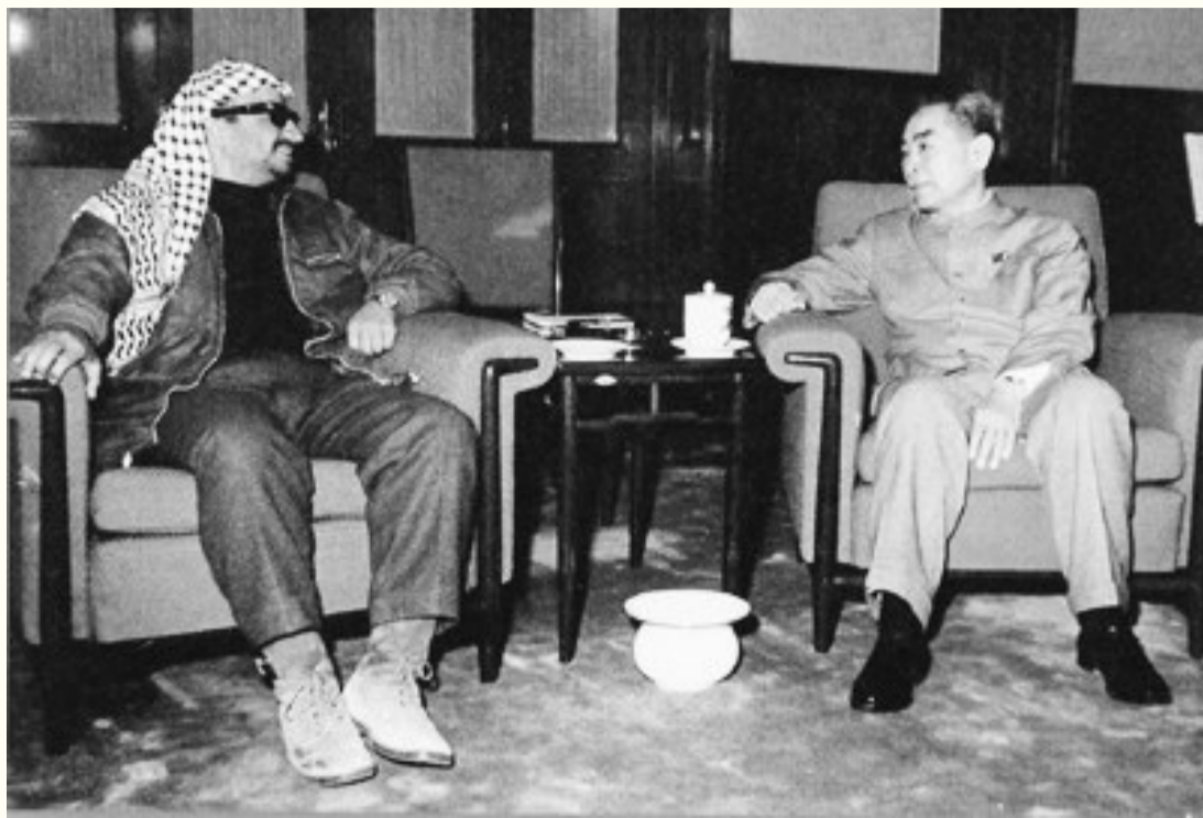
1970年3月27日，中国国务院总理周恩来会见阿拉法特

那段艰苦危险的岁月里，阿拉法特从毛主席关于游击的著作中汲取了不少军事智慧、经验和信心。阿拉法特尤其喜欢毛主席的《愚公移山》，读了很多遍。他亲口说道：“中国人的这种精神是很可贵的，不是拿钱可以换来的。中国的精神就是不怕帝国主义。我也不怕帝国主义，我就是毛泽东说的‘愚公’，要搬走帝国主义这座大山！”