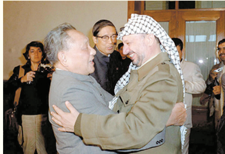
1981年10月9日，邓小平会见阿拉法特。

那段艰苦危险的岁月里，阿拉法特从毛主席关于游击的著作中汲取了不少军事智慧、经验和信心。阿拉法特尤其喜欢毛主席的《愚公移山》，读了很多遍。他亲口说道：“中国人的这种精神是很可贵的，不是拿钱可以换来的。中国的精神就是不怕帝国主义。我也不怕帝国主义，我就是毛泽东说的‘愚公’，要搬走帝国主义这座大山！”