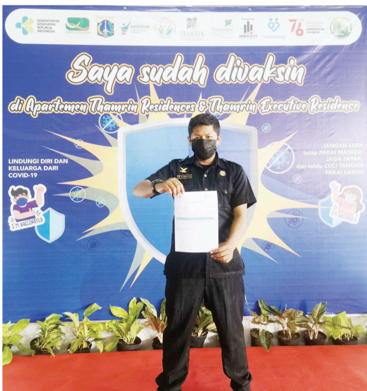
7月22日，印尼首都雅加达市中心一居民公寓小区，医护人员“上门服务”为民众接种新冠疫苗。印尼政府正试图通过加快疫苗接种速度来缓解疫情。图为完成接种的民众在留影板前拍照留念。

2004年阿拉法特病逝。胡锦涛主席致电巴勒斯坦，悼念阿拉法特逝世，称阿拉法特是巴勒斯坦卓越的国家领导人，中国人民失去了一位伟大的朋友。虽然阿