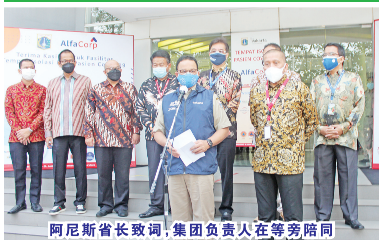
阿尼斯省长致词，集团负责人在旁陪同