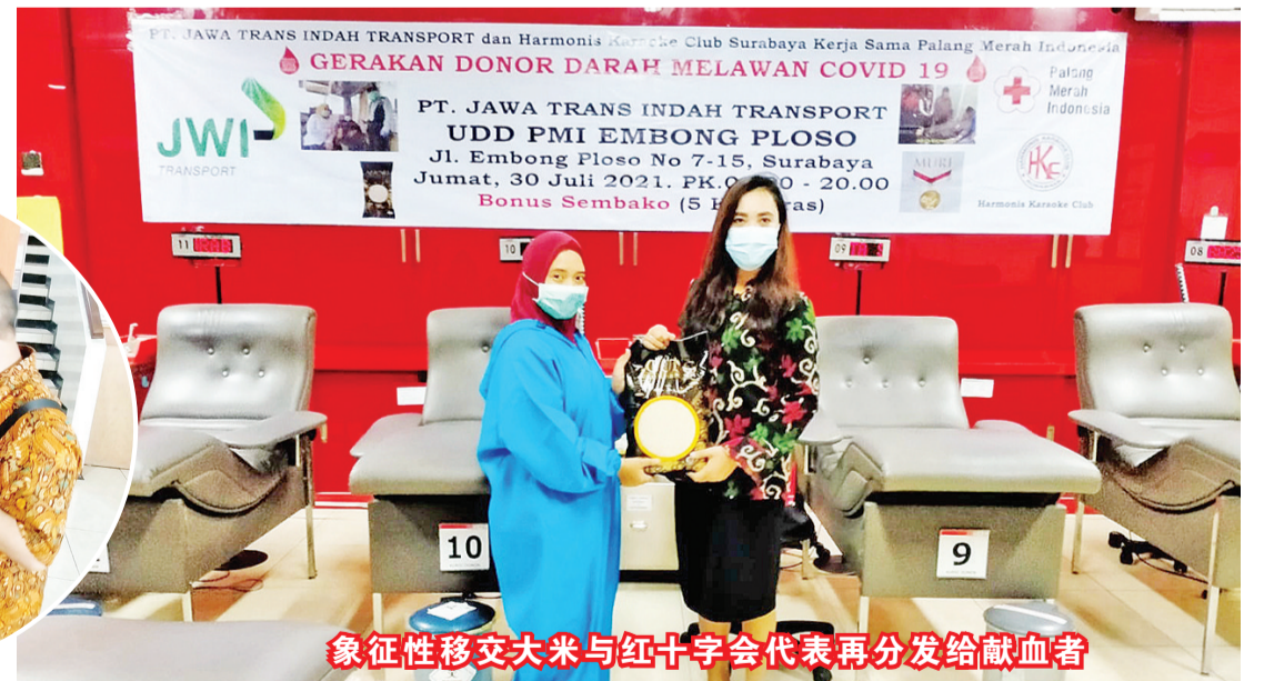
象征性移交大米与红十字会代表再分发给献血者