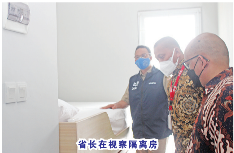
省长在视察隔离房