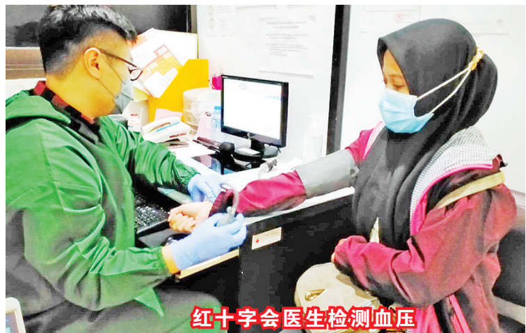
红十字会医生检测血压