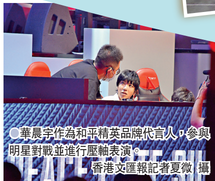
華晨宇作為和平精英品牌代言人,參與明星對戰並進行壓軸表演。