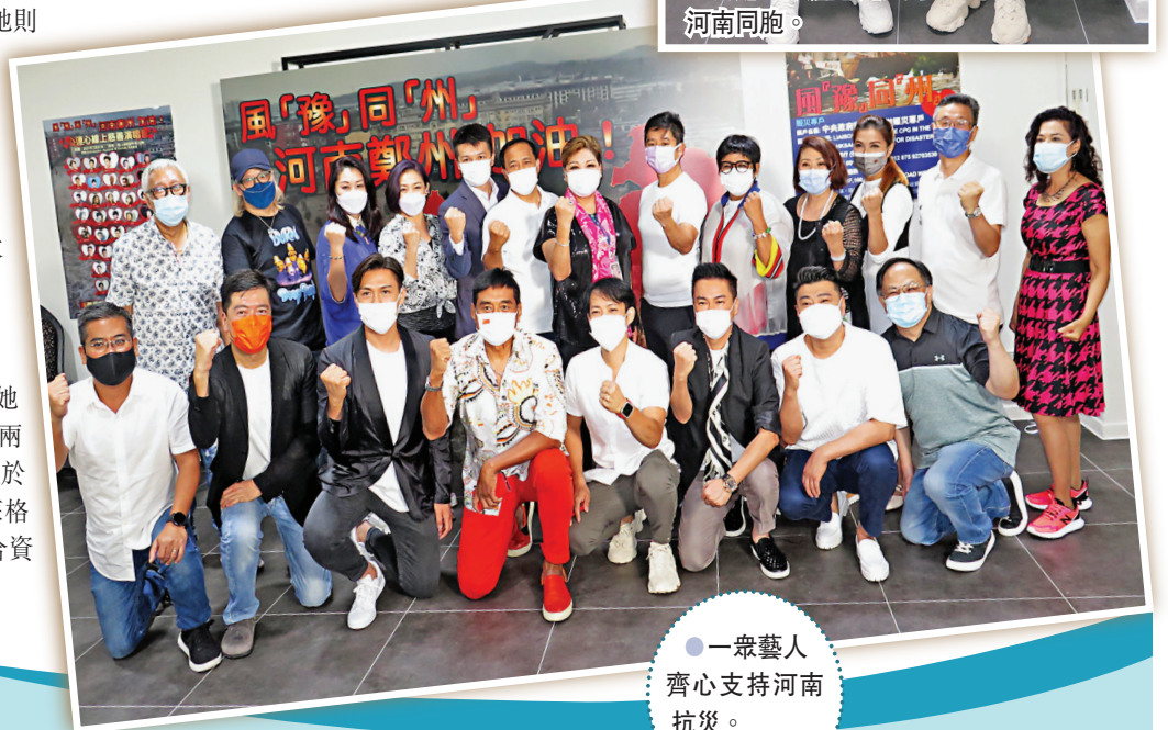
一眾藝人齊心支持河南抗災。