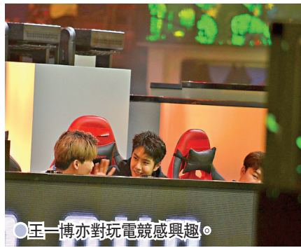
王一博亦對玩電競感興趣。

還宣布了LPL與PEL的聯動,「我一直非常關注PEL的發展,PEL作為移動電競領域一種全新的賽事形態所迸發出來的熱情與創造力令我印象深刻。」針對未來的聯動合作,騰訊互動娛樂K6合作部副總經理、騰競體育聯席CEO金亦波表示,LPL與PEL將在俱樂部、選手、解說等領域呈現更多精彩紛呈的合作內容。