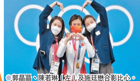
郭晶晶、陳若琳(左)及施廷懋合影比心。

她談到中國跳水隊時表示:「整個隊伍這次東京奧運真的不容易,推遲了一年,跟着封閉訓練,希望她們取得好成績。」她尤其心疼一些老將,像王涵、施廷懋都30歲了,自己在她們這個年齡已經退役了,她們堅持到現在很不容易,慶幸大家都發揮自己的最好水平。