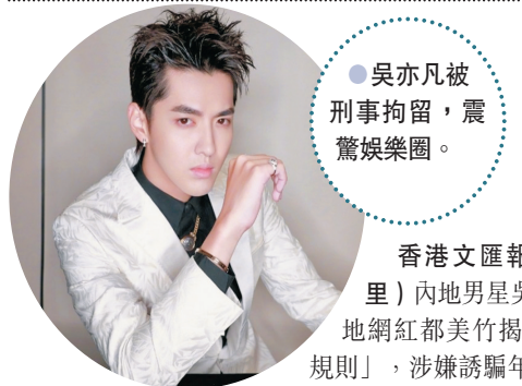
吳亦凡被刑事拘留,震驚娛樂圈。

香港文匯報訊(記者達里)內地男星吳亦凡早前被內地網紅都美竹揭發有「選妃潛規則」,涉嫌誘騙年輕女性上床,北京公安日前透過官方微博「平安北京朝陽」發布最新消息,指吳亦凡涉嫌強姦罪,目前被刑事拘留。