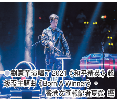
劉憲華演唱了2021《和平精英》超級盃主題曲《Born A Winner》。