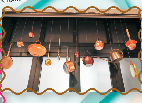
當代工藝師將傳統工藝糅合功能性和設計美學，在展覽中呈現。