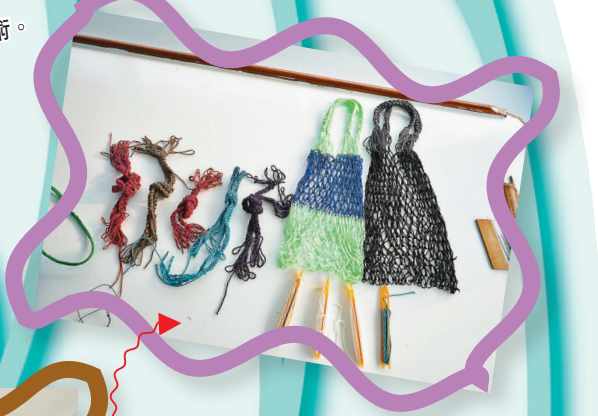
漁網編織講述本地傳統漁業技藝的故事。