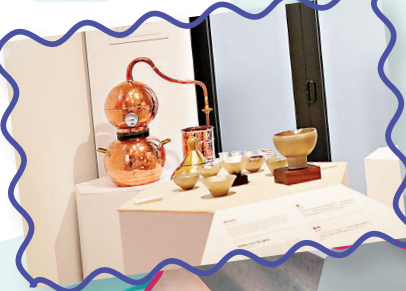
「點藝成金」展出香港和日本的工藝師所創作的金屬工藝品，左一為《純銅壺式蒸籠器》。