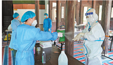
2日，醫務人員在南京市核酸檢測點進行消毒。