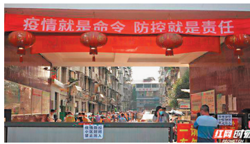
張家界加強小區管理，原則上不准外出。