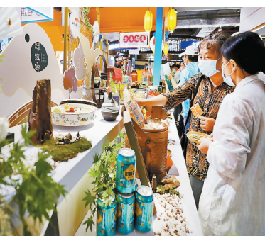
上海上半年全市社會消費品零售總額9,048.44億元。圖為參觀者5月在上海舉行的中華老字號博覽會上挑選商品。資料圖片

目前，上海消費供給引領潮流，世界知名高端品牌集聚力度超過90%，首店、旗艦店數量居全國第一，國際品牌紛紛選擇上海開展新品首發活動。據中商數據統計，今年上半年上海市新設各類首店513家，同比增長60.3%，基本恢復至疫情前水平，全年首店數量有望突破1,000家。