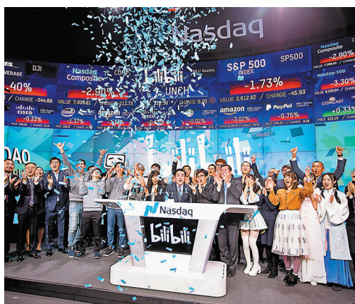
中證監表示，中美加強監管合作是必然選擇。圖為2018年中國視頻網站哔哩哔哩登陸納斯達克。資料圖片

香港文匯報訊 美國證券交易委員會(SEC)上周五發布聲明，增加了對中國企業赴美上市的信息披露要求。對此，中國證監會新聞發言人1日回應稱，中美兩國資本市場作為全球重要的市場，相互聯繫日益緊密，越來越多的企業、投資者、金融機構相互參與對方市場，加強監管合作是必然的選擇。