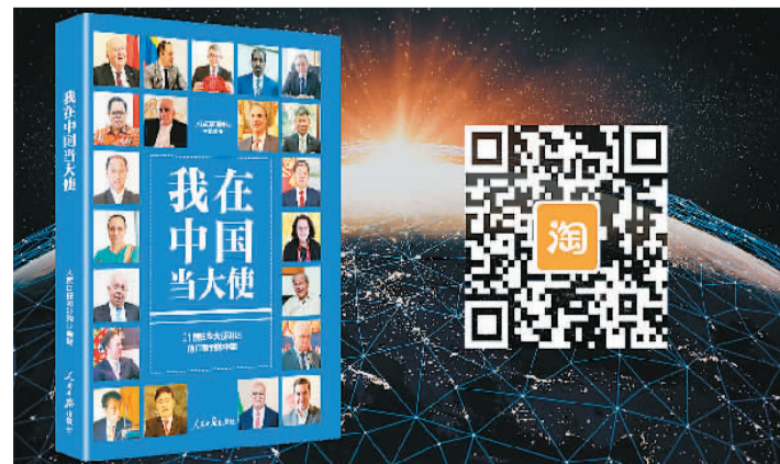
《我在中国当大使》一书近日出版。