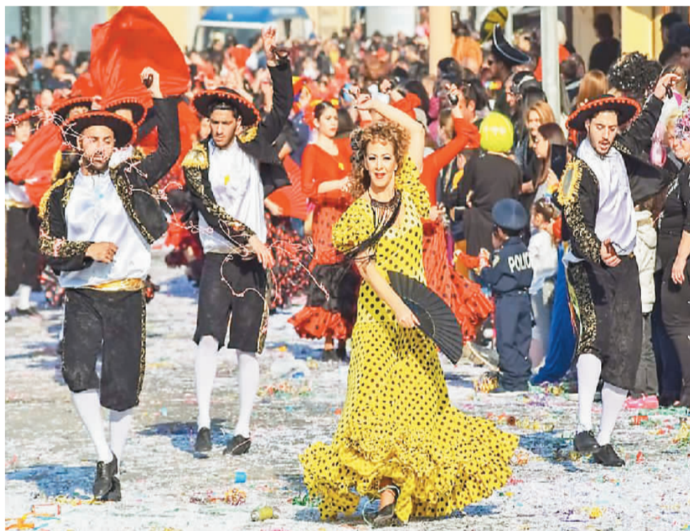
塞浦路斯狂欢节。