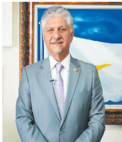
塞浦路斯驻华大使安东尼斯·图马齐斯近照。