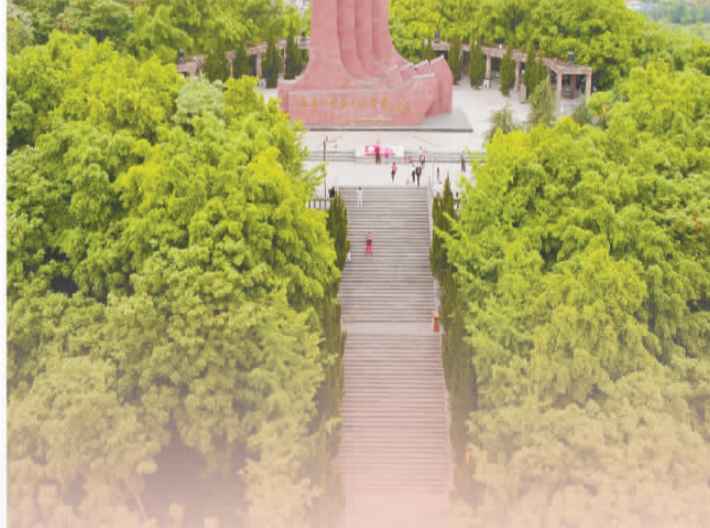
图③：位于广西桂林市全州县的红军长征湘江战役纪念馆。