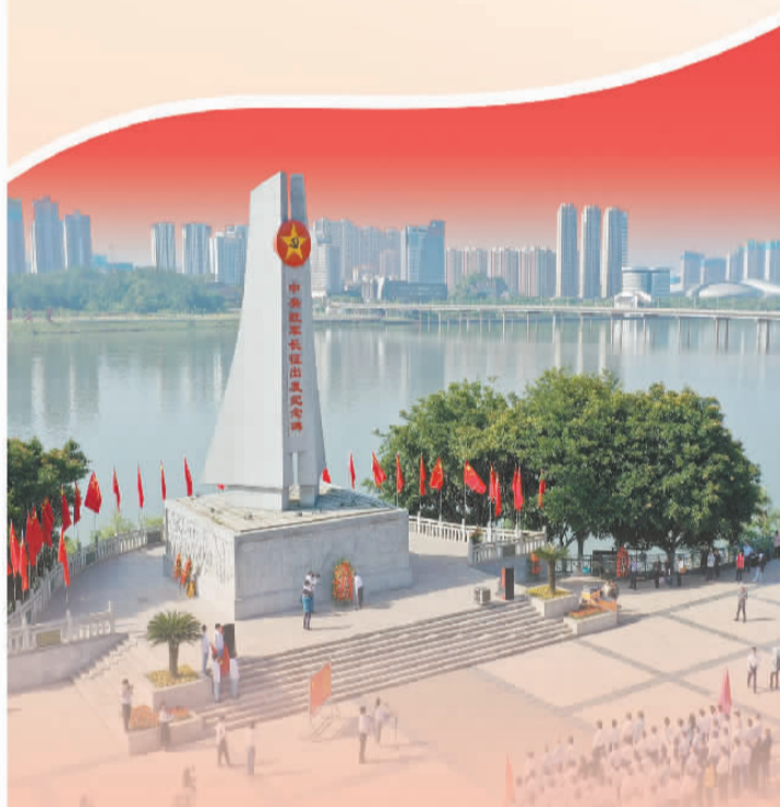
图①：位于江西赣州市于都县的中央红军长征出发地纪念碑。